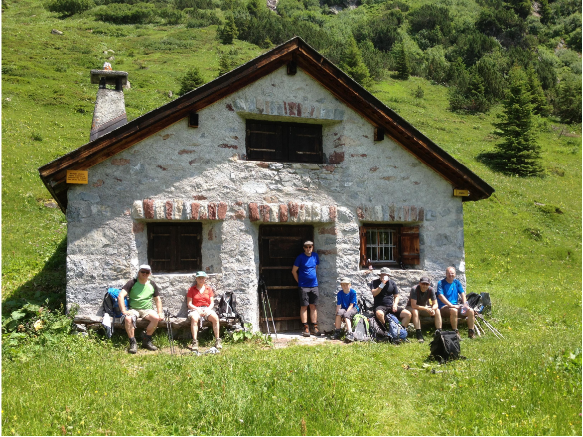
Verlassene Hütte, mit dem bei 32°, endlich ERLÖSENDEN Brunnen!