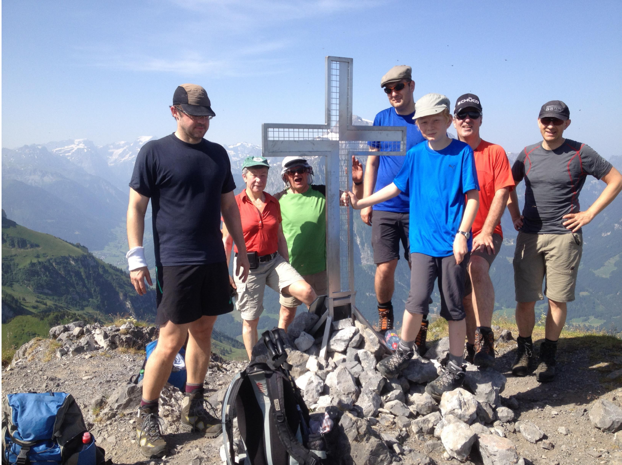
Auf dem Gipfel vom Fronalpstock