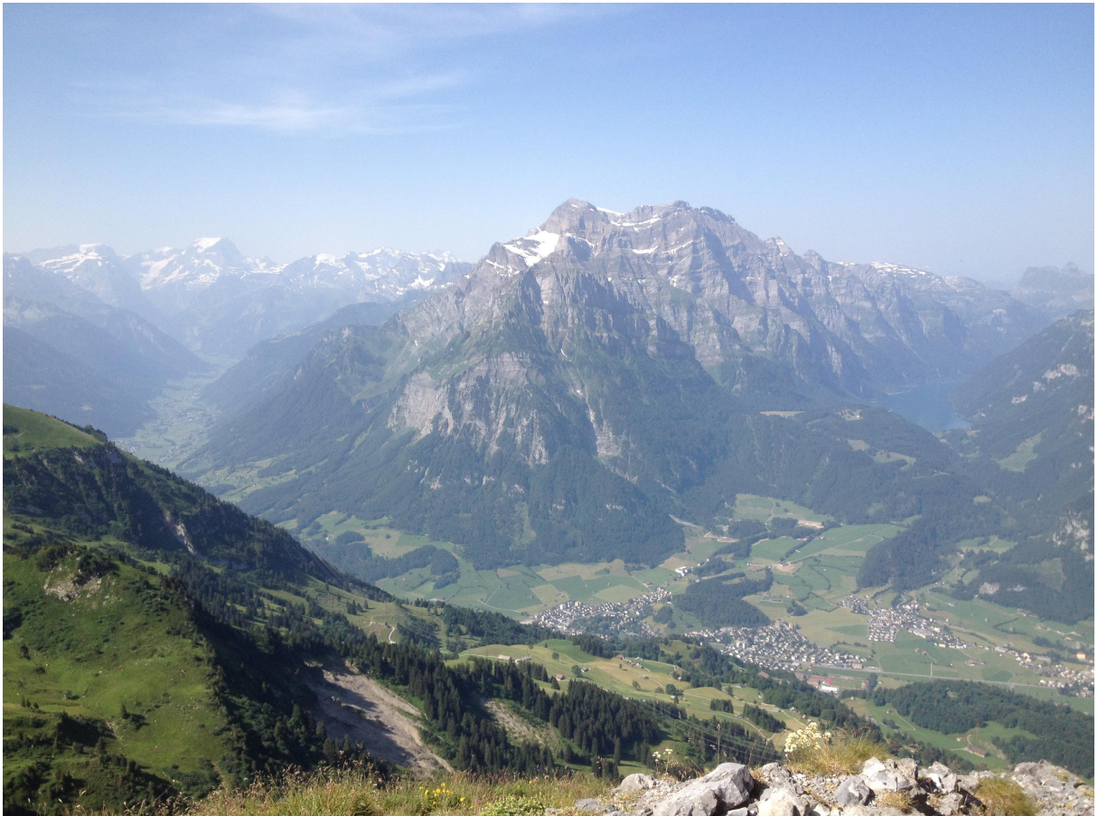
Aussicht vom dem Gipfel des Fronalpstock zum Glärnisch und rechts ins Klöntal, links hinten der Tödi