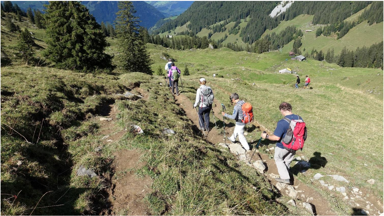
Die Truppe kurz vor der Mittagrast unterhalb vom Brisenhaus.....

.....die folgende Schlemmerei ist den Teilnehmenden vorbehalten..... ;-)