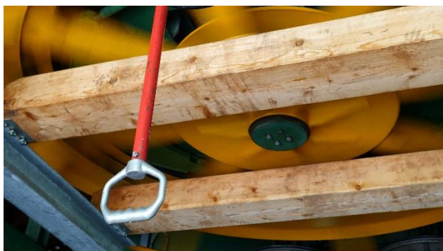
Was passiert, wenn ich hier ziehe?.....