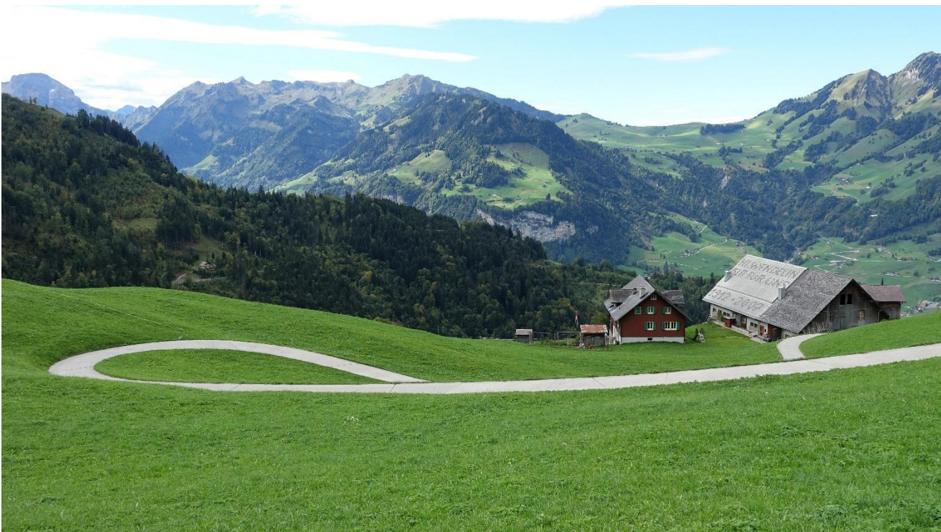
Hmhh...., das feine Dessert wartet schon in Niederrickenbach auf uns.....

.....die folgende Schlemmerei ist den Teilnehmenden vorbehalten..... ;-)