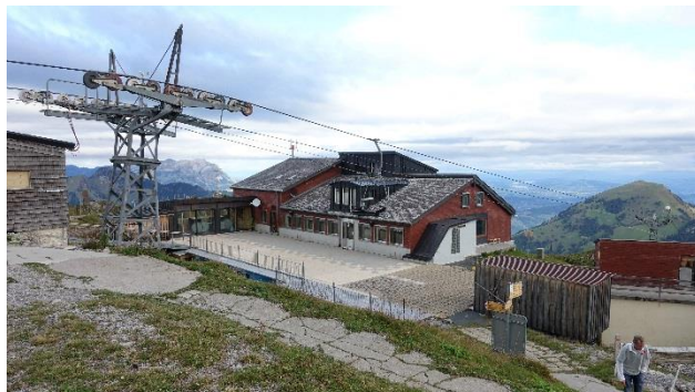
.....dann kommt hier keiner mehr an ;-)