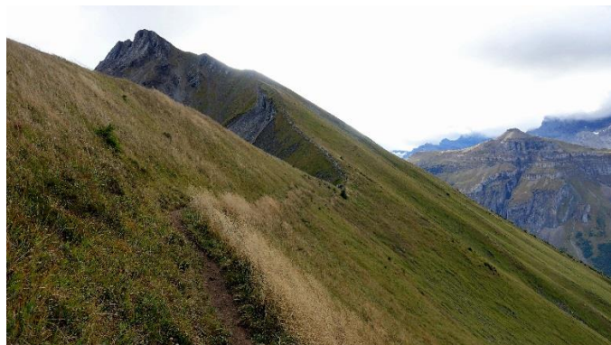
Das Ziel, der Brisen im Hintergrund. Auf dem Grat voll im Wind, hinter dem Grashügel im Windschatten