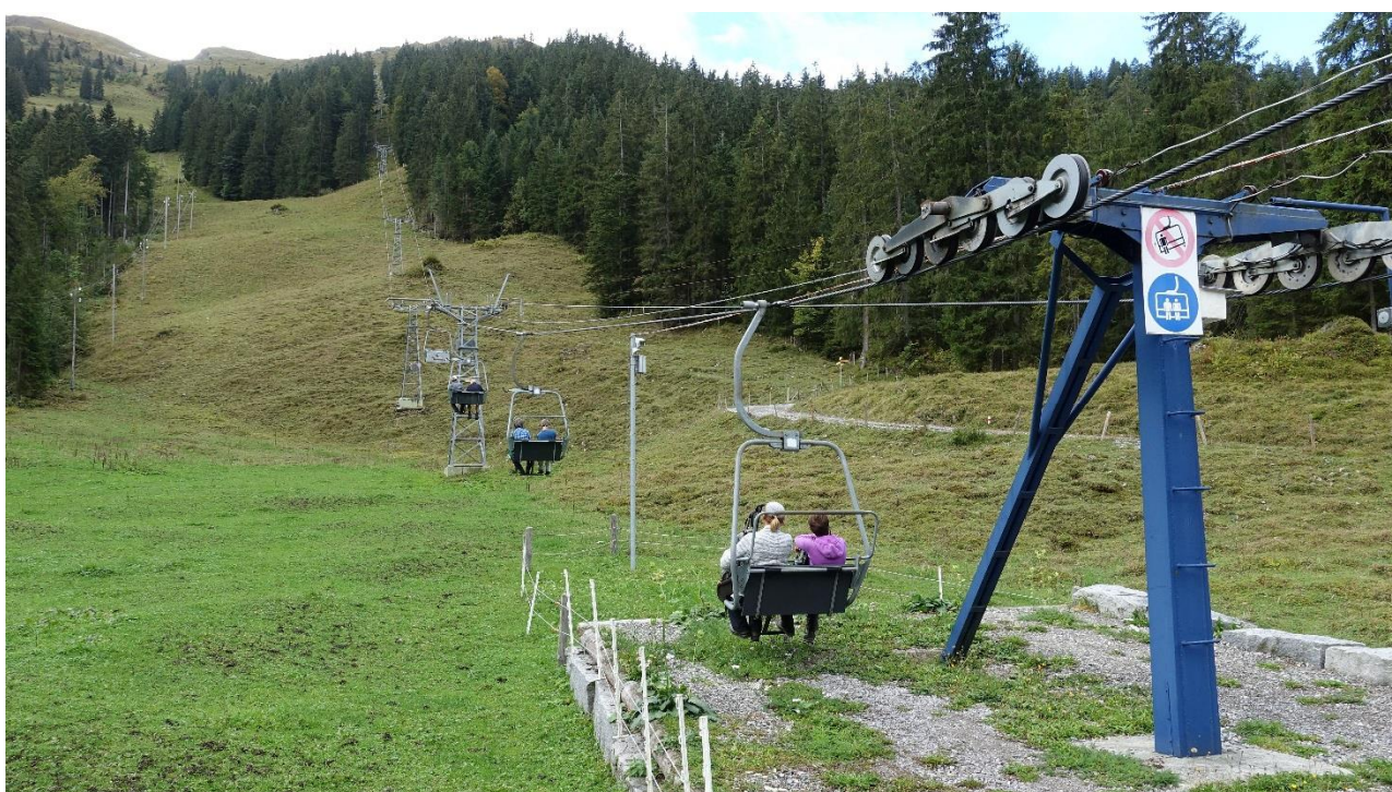
Im Sässeli zum Haldigrat hinauf