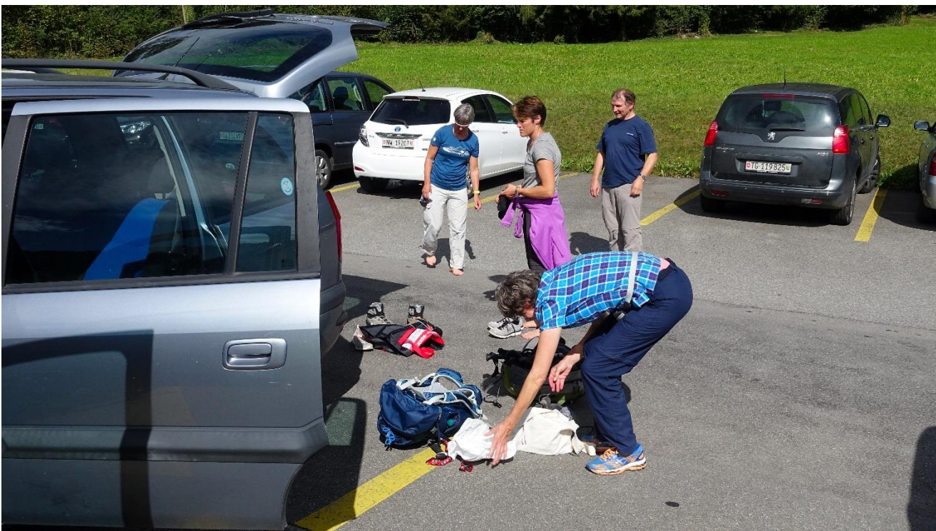
Zusammenpacken und ab nach Hause!