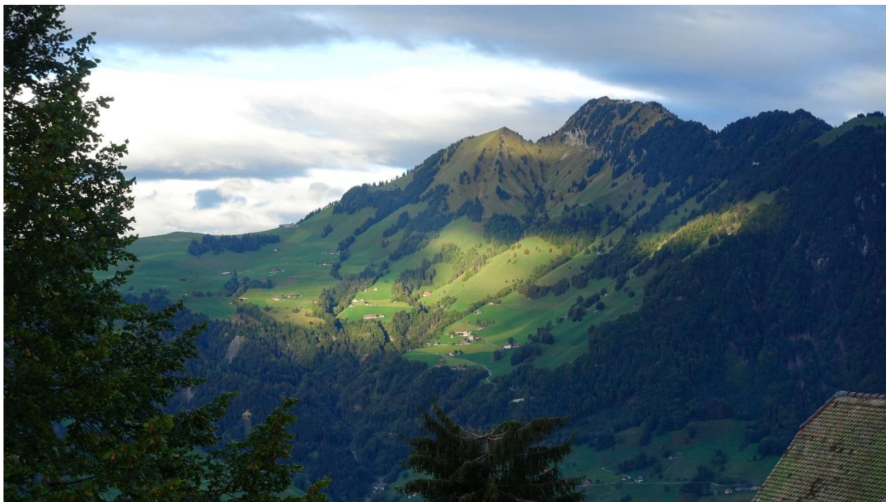
Blick in Richtung Stanserhorn und Wirzveli, mit einem Sonnenloch