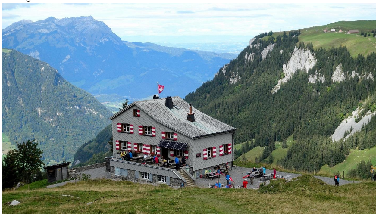
Das SAC Brisenhaus, links hinten der Pilatus, recht die Musenalp