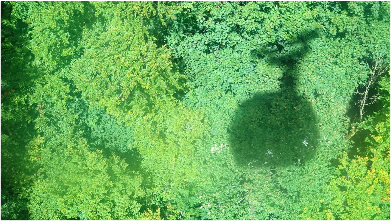
Abfahrt mit der Seilbahn von Niederrickenbach nach Dallenwil ins Engelbergertal