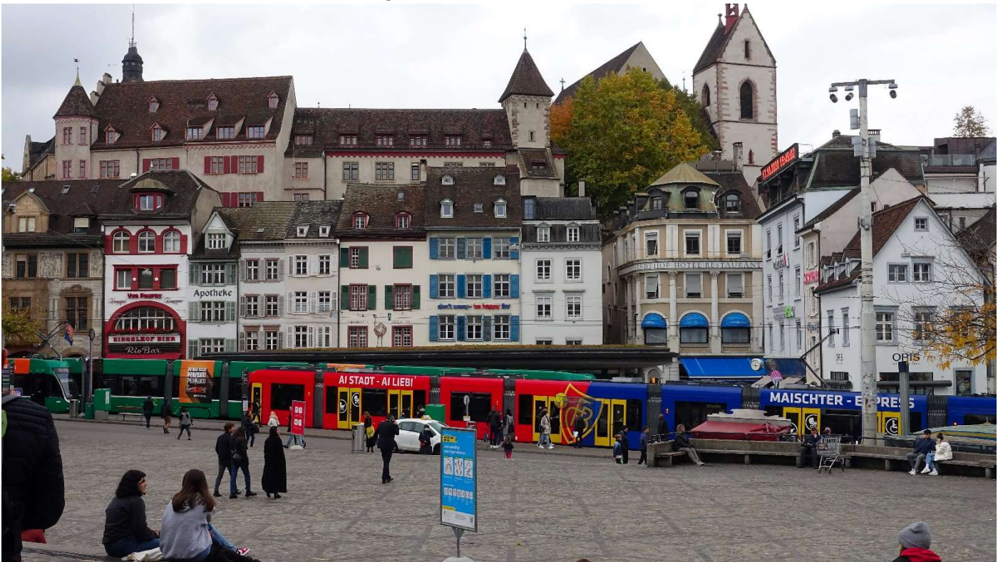
Der Barfüsserplatz, gerade mit dem (ehemaligen) „Meischter-Drämmli“