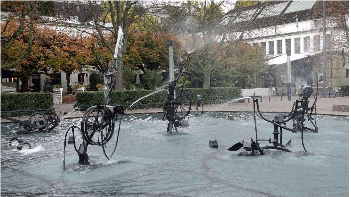
Der Fasnachtbrunnen, besser bekannt als Tingueli-Brunnen