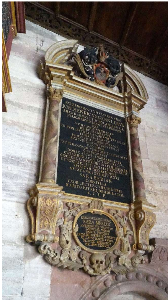
Alte Grabsteine von Edelsleuten