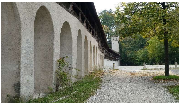
Stadtmauern mit Wehrgang im St. Alban Tal