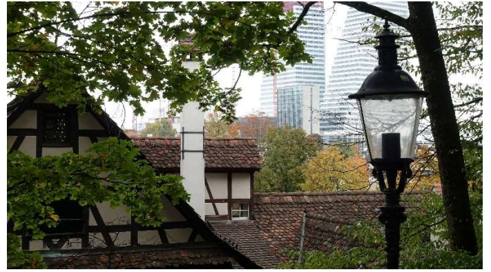
Alt und modern