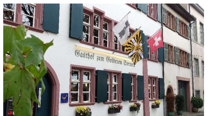
uralte Beiz „zum goldenen Stern“