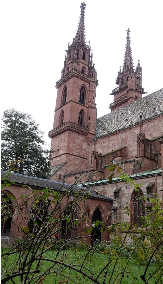
Gotischer und romanischer Baustil gemischt