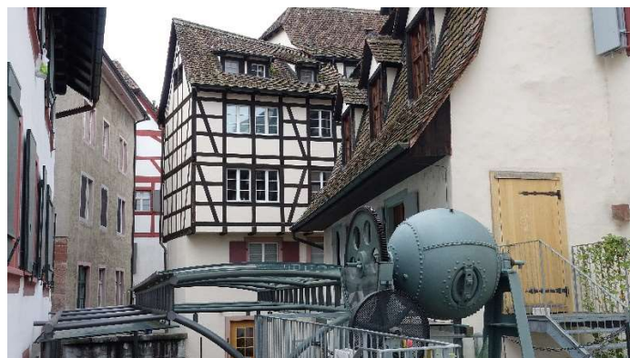
Bei der alten Papierri