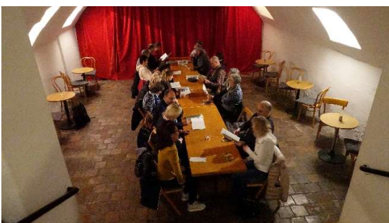
„Im dieffe, dunggle Käller“ im Café zum Issak am Münsterplatz