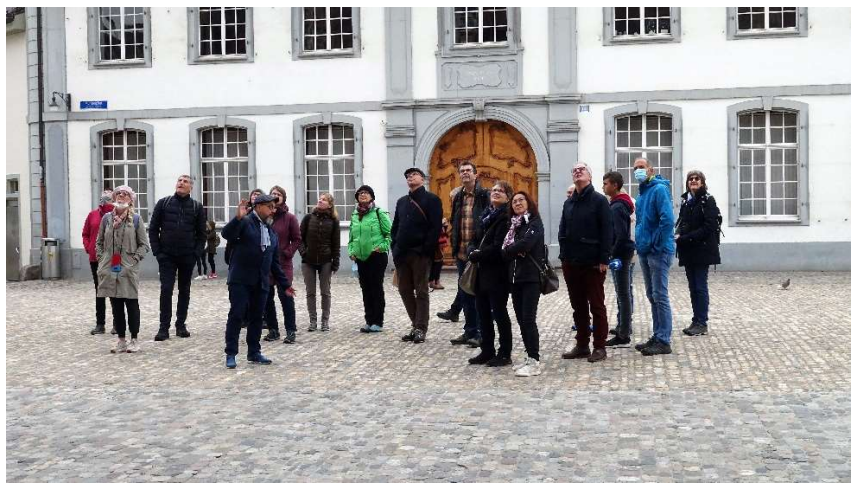
Interessiert verfolgt die Truppe den Erklärungen am Münster