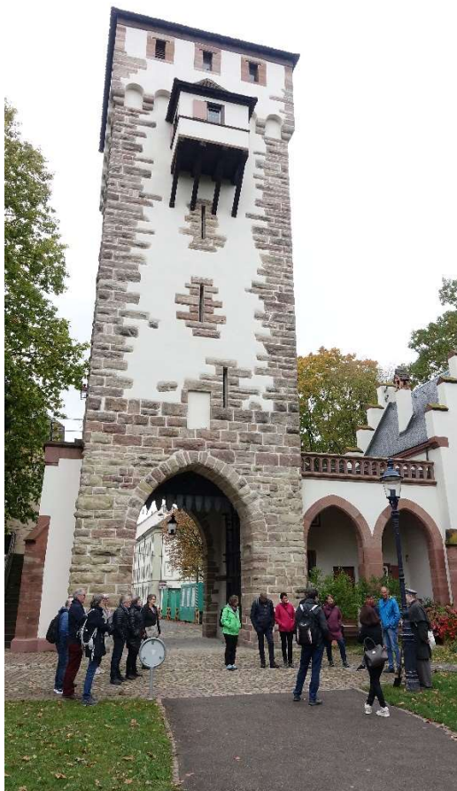
Vor dem St. Alban Tor