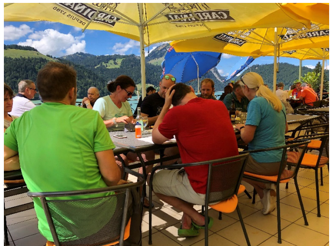
High Noon, 12.00 Uhr!