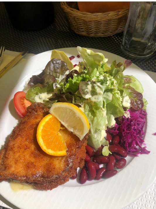
That's it 😊