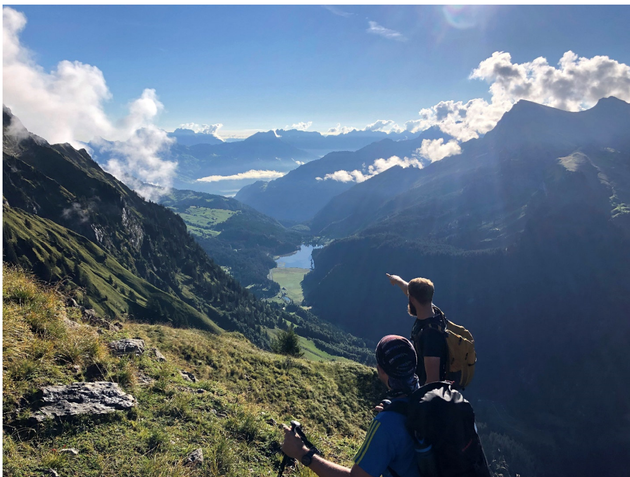
Glasklarer Ausblick in Richtung Osten