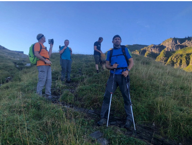
Ja, Res... es geht gleich weiter zum Cordon Bleu