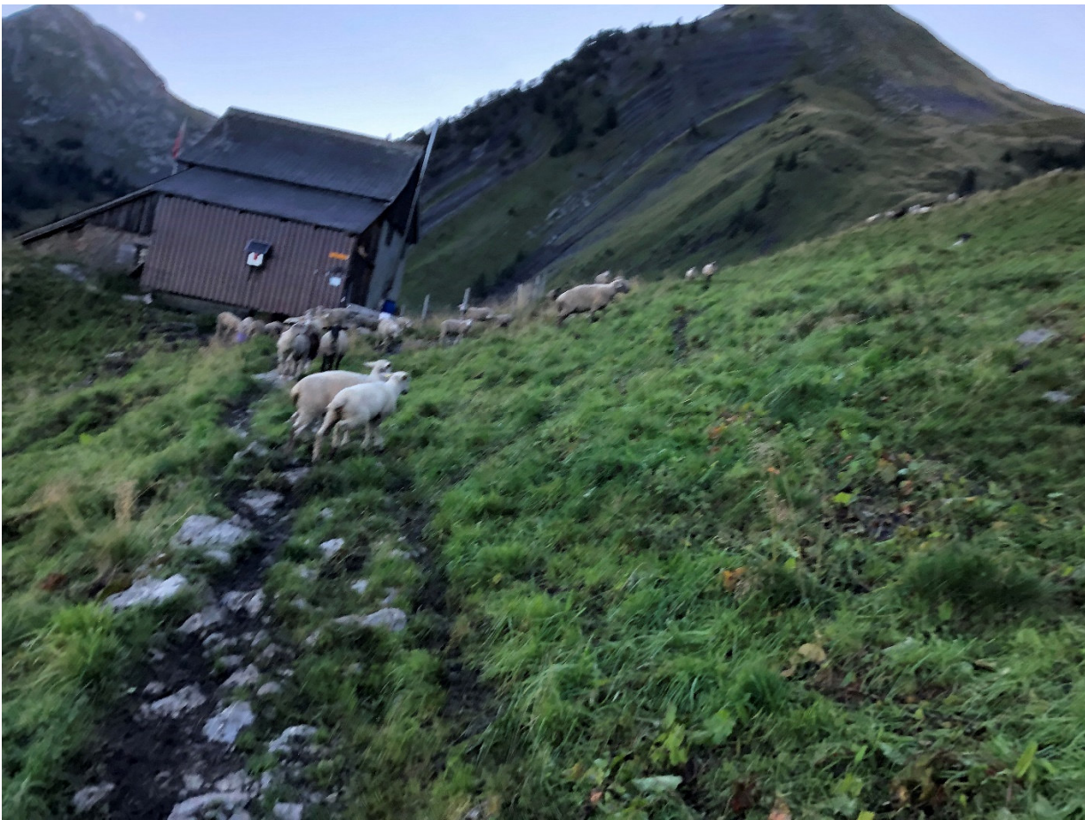
Uuups, das war der Fotograf noch nicht ganz wach...