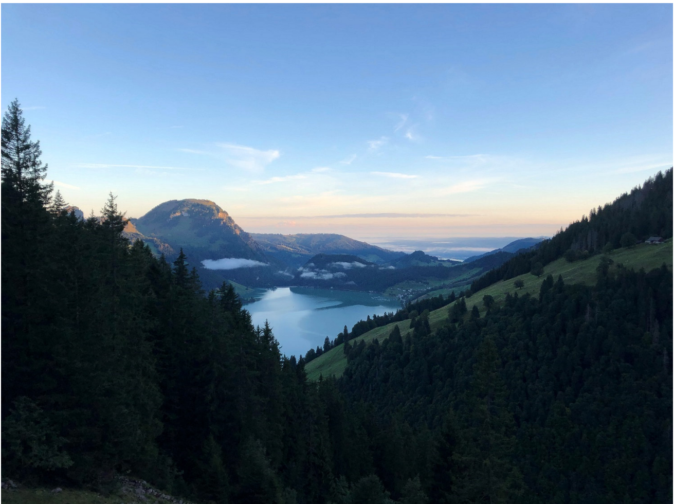
Bereits einige hundert Meter über dem Wägitalersee