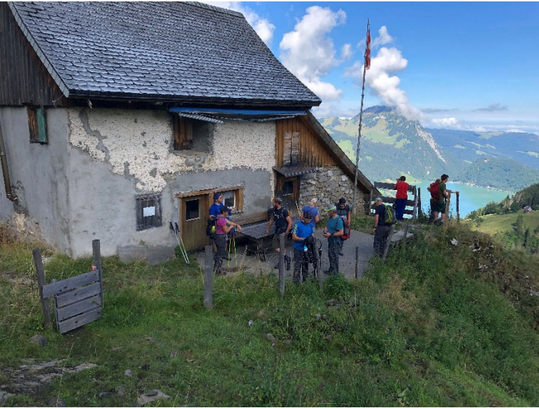
Putzete auf ebener Ebene...