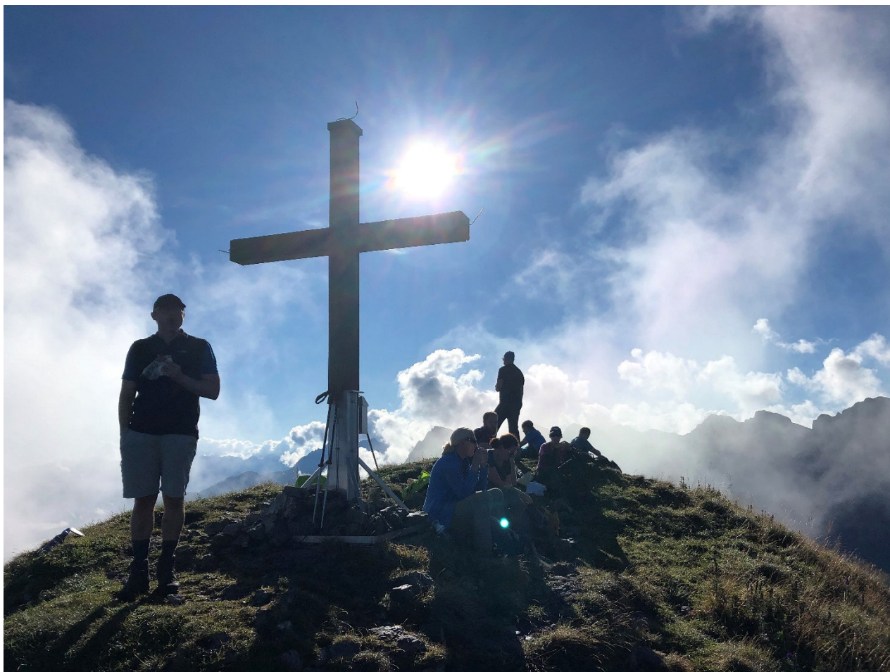
Das ist ein Leben....