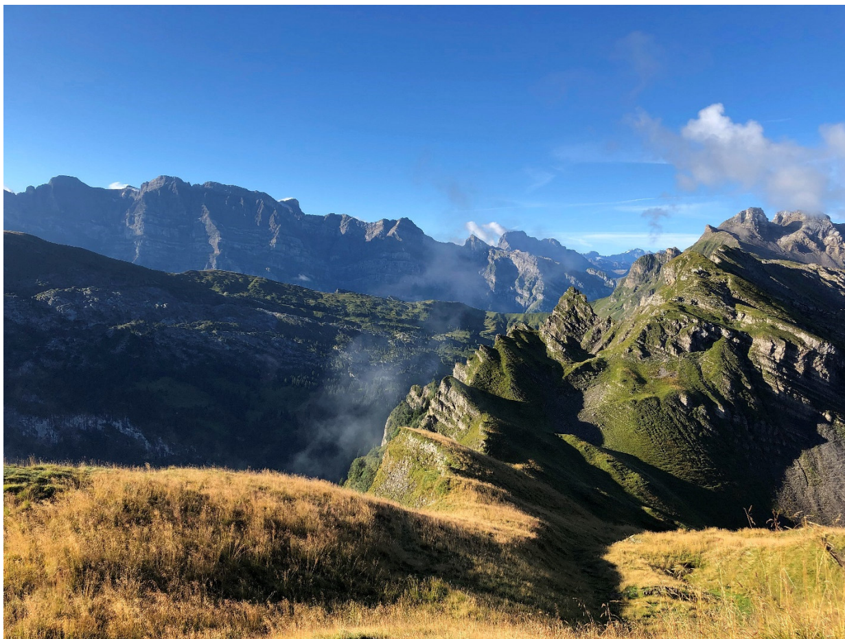
Die ersten Sonnenstrahlen, 100 Höhenmeter unter dem Gipfel!