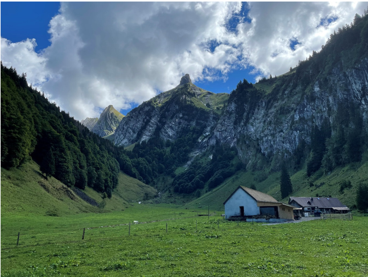
Jaaaa, genau: Der Zindelspitz beim Blick zurück! (Die Pfeilspitze in der Mitte) Es ist 11.00Uhr