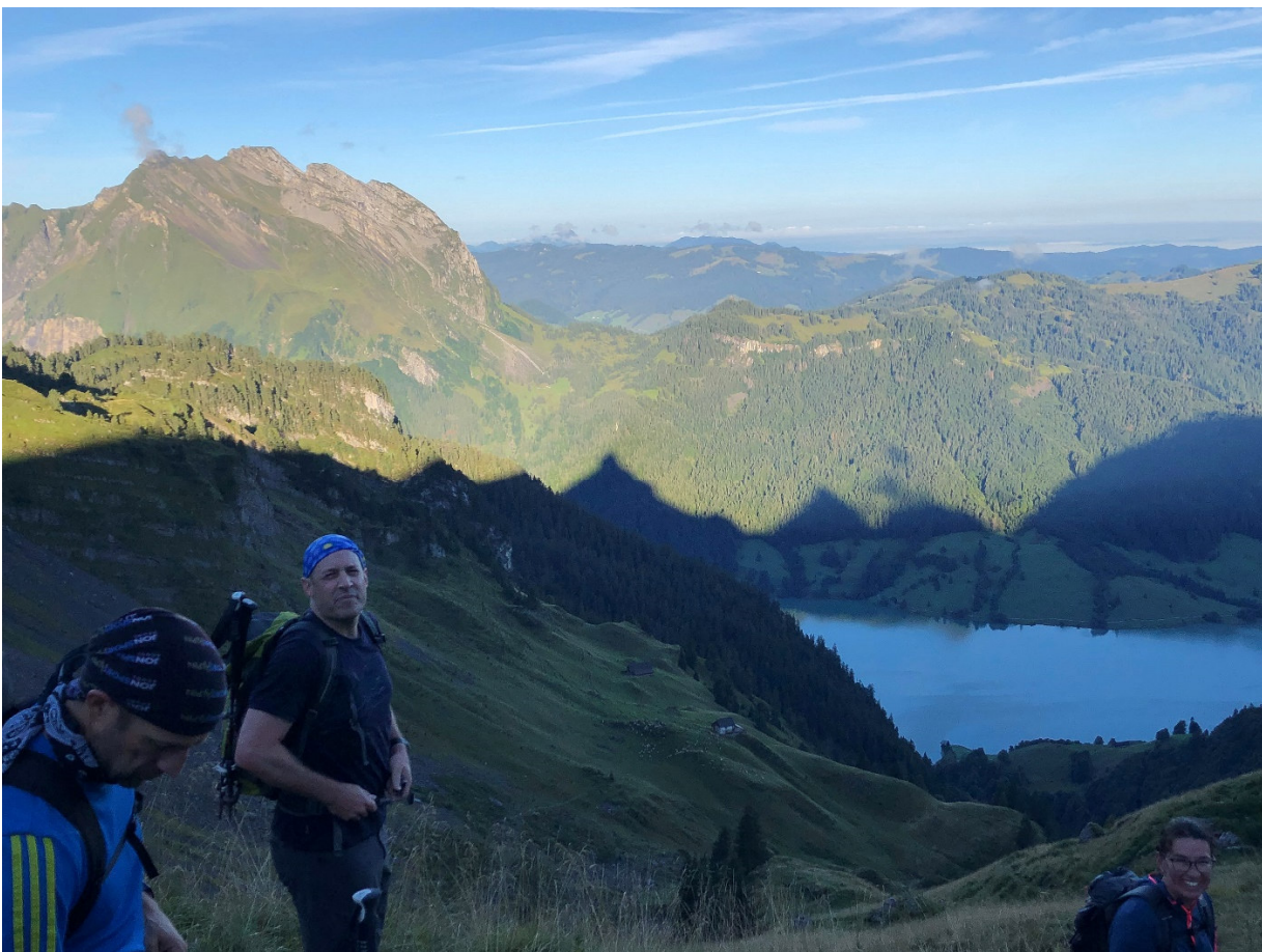
Der höchste «Schattenwurf» in der Mitte ist der Zindelspitz, links hinten oben der «Fluebrig» (2023!)