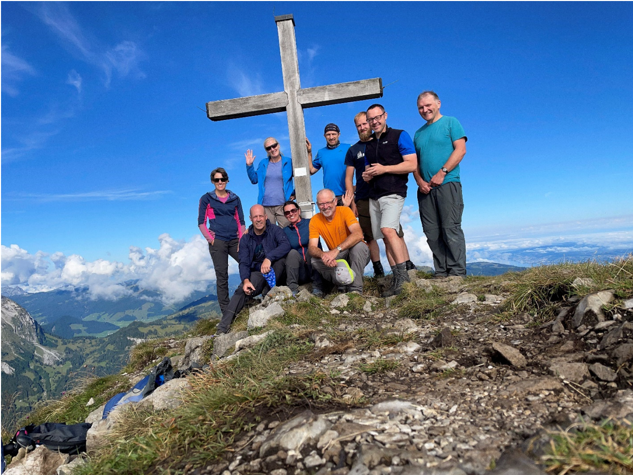
Das Stativ halt...aber wenigstens ein Stativ!