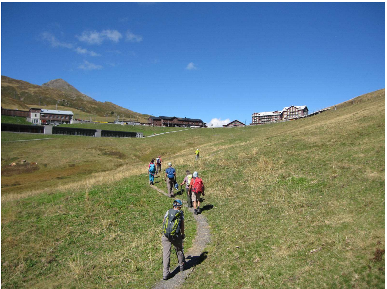
Ziel in Sicht!