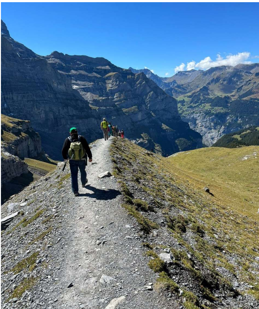
Über die Moräne des schon lange zurückgezogenen Eigergletschers Richtung kleine Scheidegg