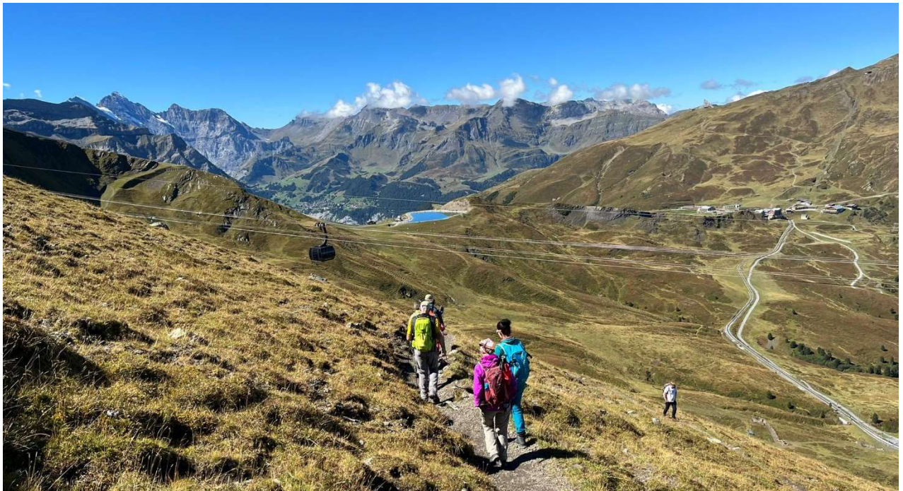
Immer gutgelaunt unterwegs zur Station Eigergletscher