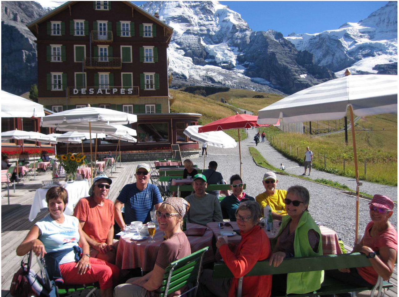
Gemütlicher Abschluss auf der Terrasse des Hotels Bellvue des Alpes, kleine Scheidegg