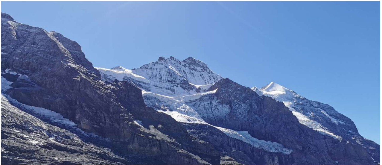
... und Jungfrau, rechts hinten ist das Silberhorn