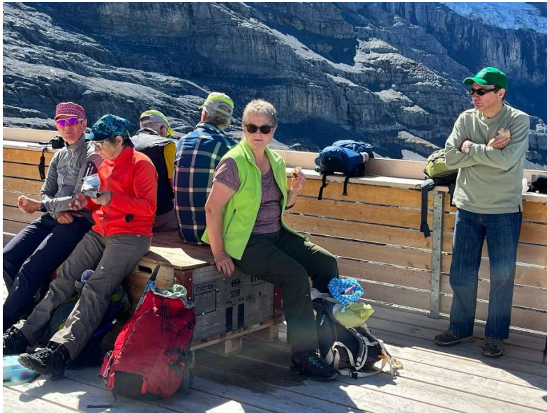
Mittagslunch bei der Station Eigergletscher