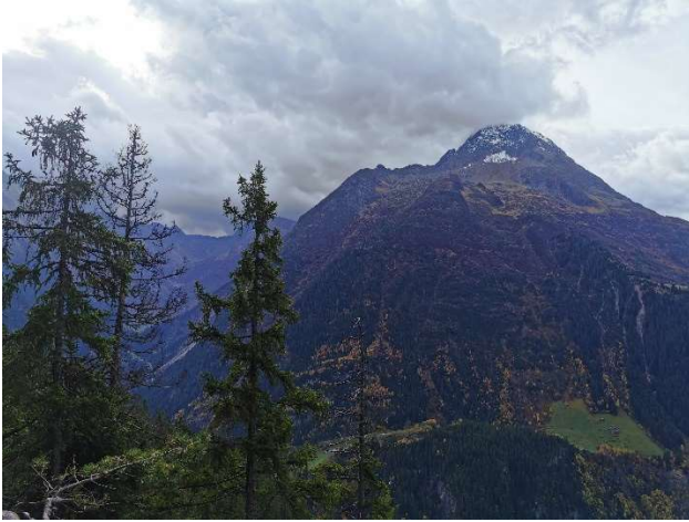
Aussicht auf den Bristen 3073m