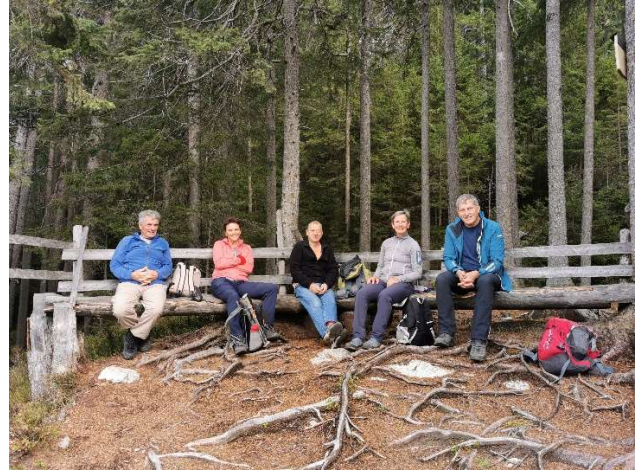
windiger Picknickplatz Eisten 1440m