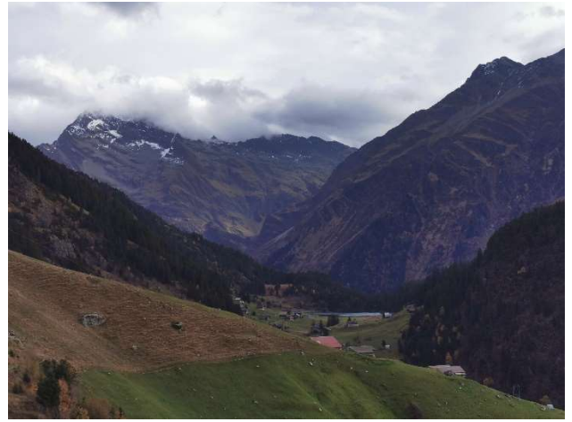
Ziel Golzernsee in Sicht