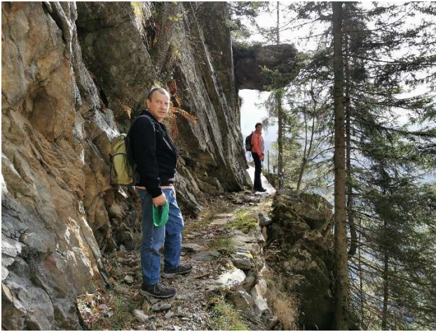
Gut gesicherter Weg