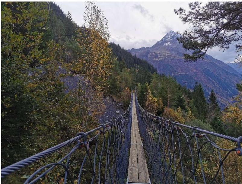
Hängebrücke über den Schipfenbach