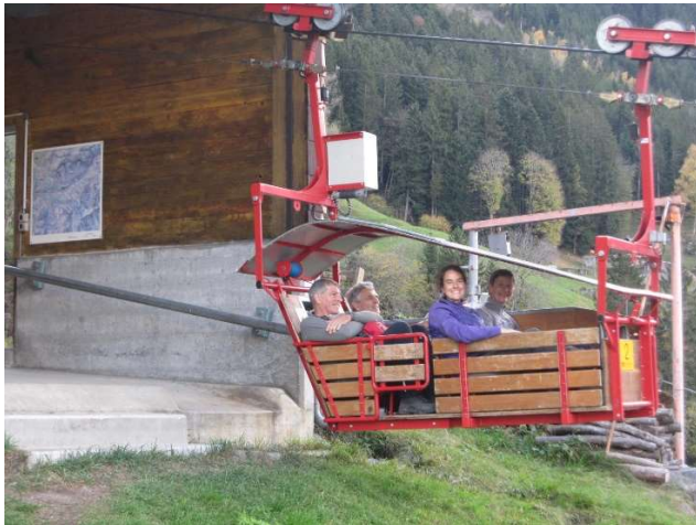
Helens Premiere in der offenen Seilbahn

Die letzte Wanderung 2022 fand unter herbstlichen Bedingungen statt. Beim Start bei der Bergstation Chilcherberge blies der Föhn schon recht stark. Im Wald wurde es ruhiger.