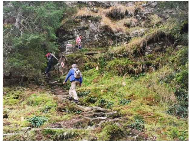
Zum Schluss: Golzern Seerundgang