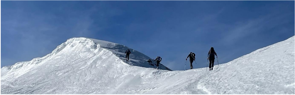
Nur kurz wurde es auf dem Grat etwas «luftig»