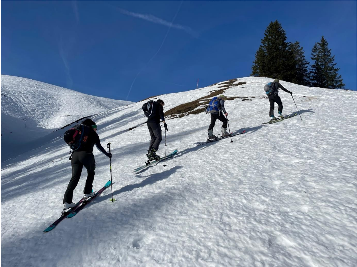
Im Aufstieg – Schnee hat es genug (meistens)