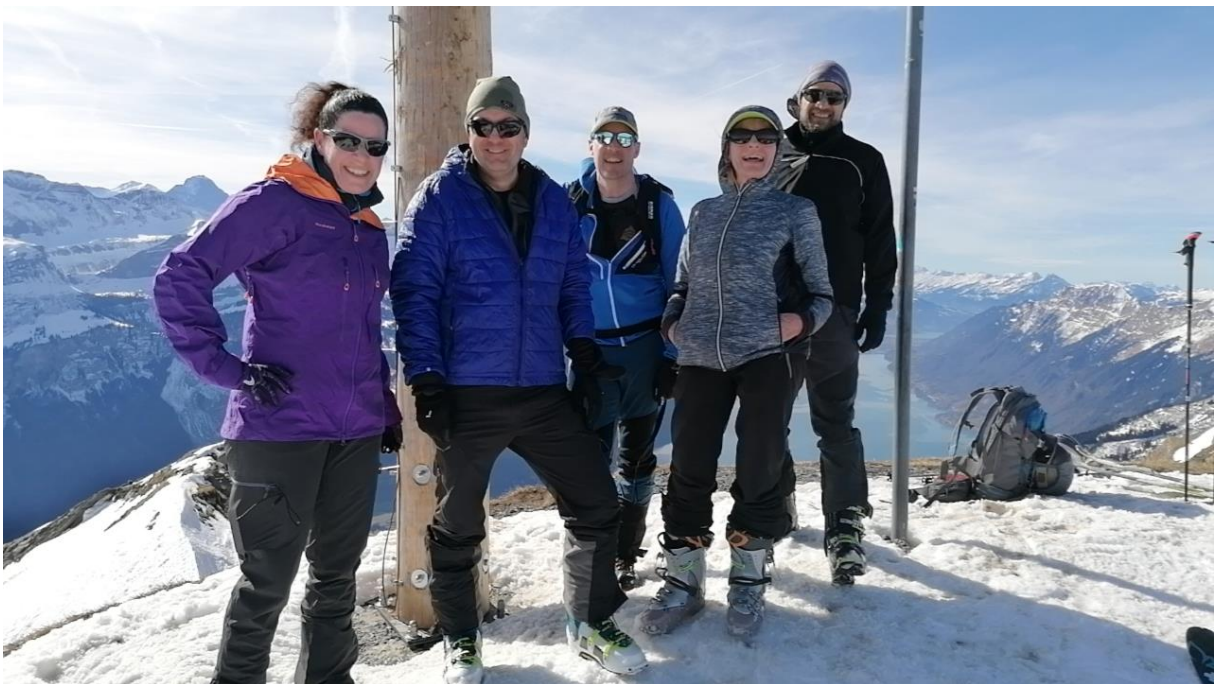
Das obligate Gipfelfoto