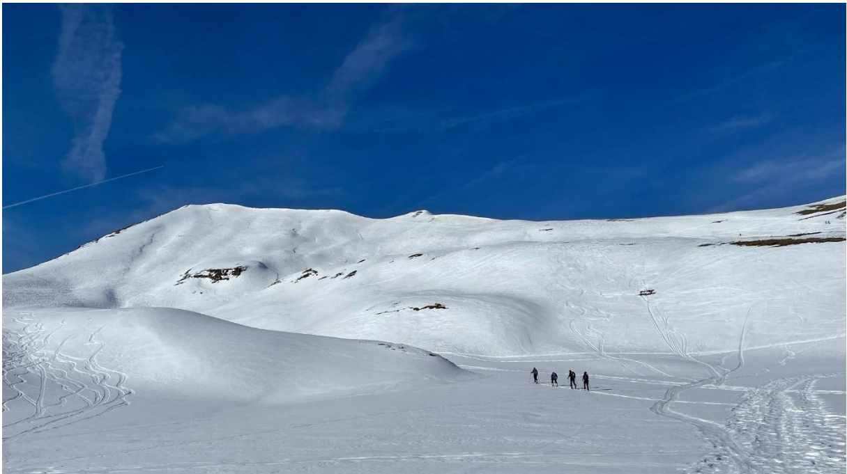
Den Gipfel (Höch Gumme) im Blick