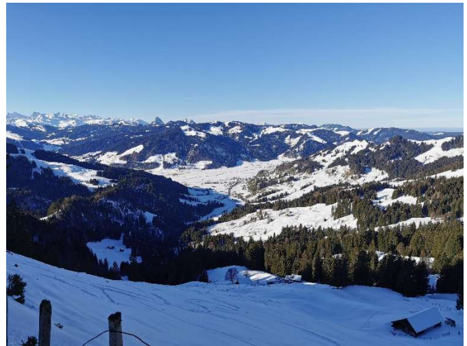
Sihlsee mit Studen