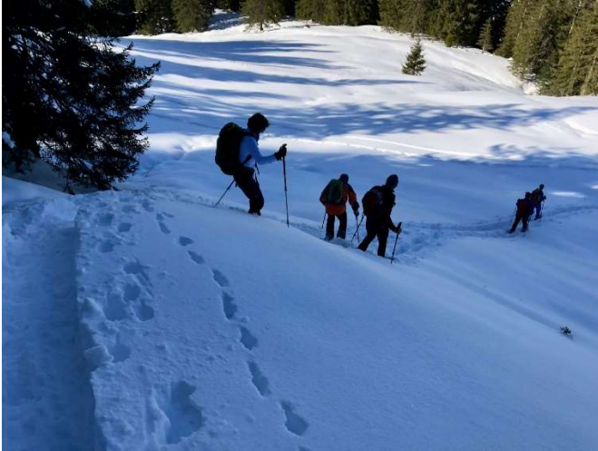
Abstieg Richtung Dorlauri