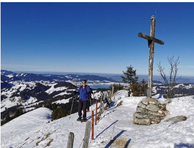
Rony kommt kurz vor dem Gipfel

Ein steiler Hang konnte dank der günstigen Lawinensituation sicher gequert werden, so wird die Wildegg bald erreicht. Der chli Aubrig ist nun in Sicht und zügig wandern wir dem Zwischenziel entgegen.