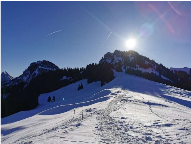
Links Gross- und unter der Sonne Chli Aubrig

Alle Oberfreiamter Naturfreunde trafen pünktlich am Treffpunkt ein, so dass wir schon vor neun Uhr auf der Staffelegg loswandern konnten.