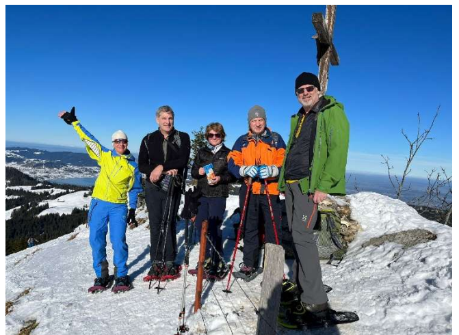
Gipfelfoto auf dem Chli Aubrig