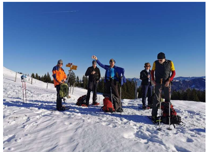
verdiente erste Pause

Ein steiler Hang konnte dank der günstigen Lawinensituation sicher gequert werden, so wird die Wildegg bald erreicht. Der chli Aubrig ist nun in Sicht und zügig wandern wir dem Zwischenziel entgegen.