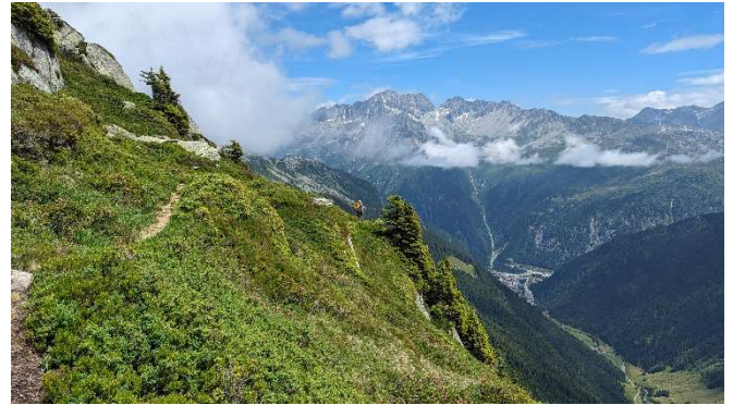
zurück bei Alt Stafel und weiter zur Salbithütte