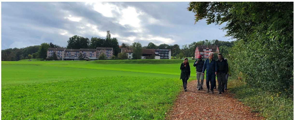
Kurz nach dem Tobelhof...