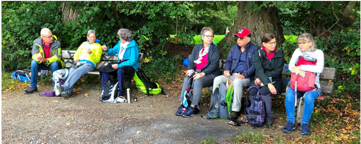
Sandwichpause mit Aussicht...