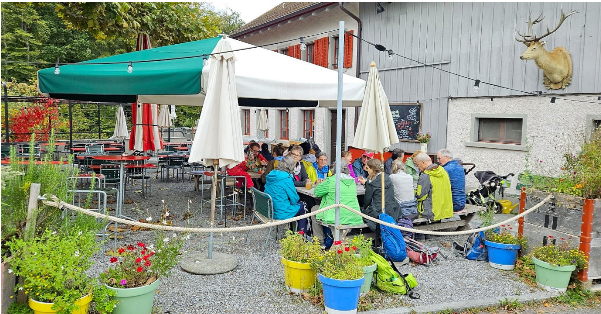
Im Restaurant Ziegelhof...und d'Miranda hät zahlt, Dankä 😊