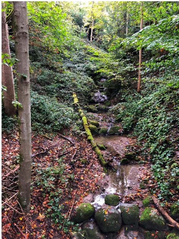
Der tosende Wolfbach...