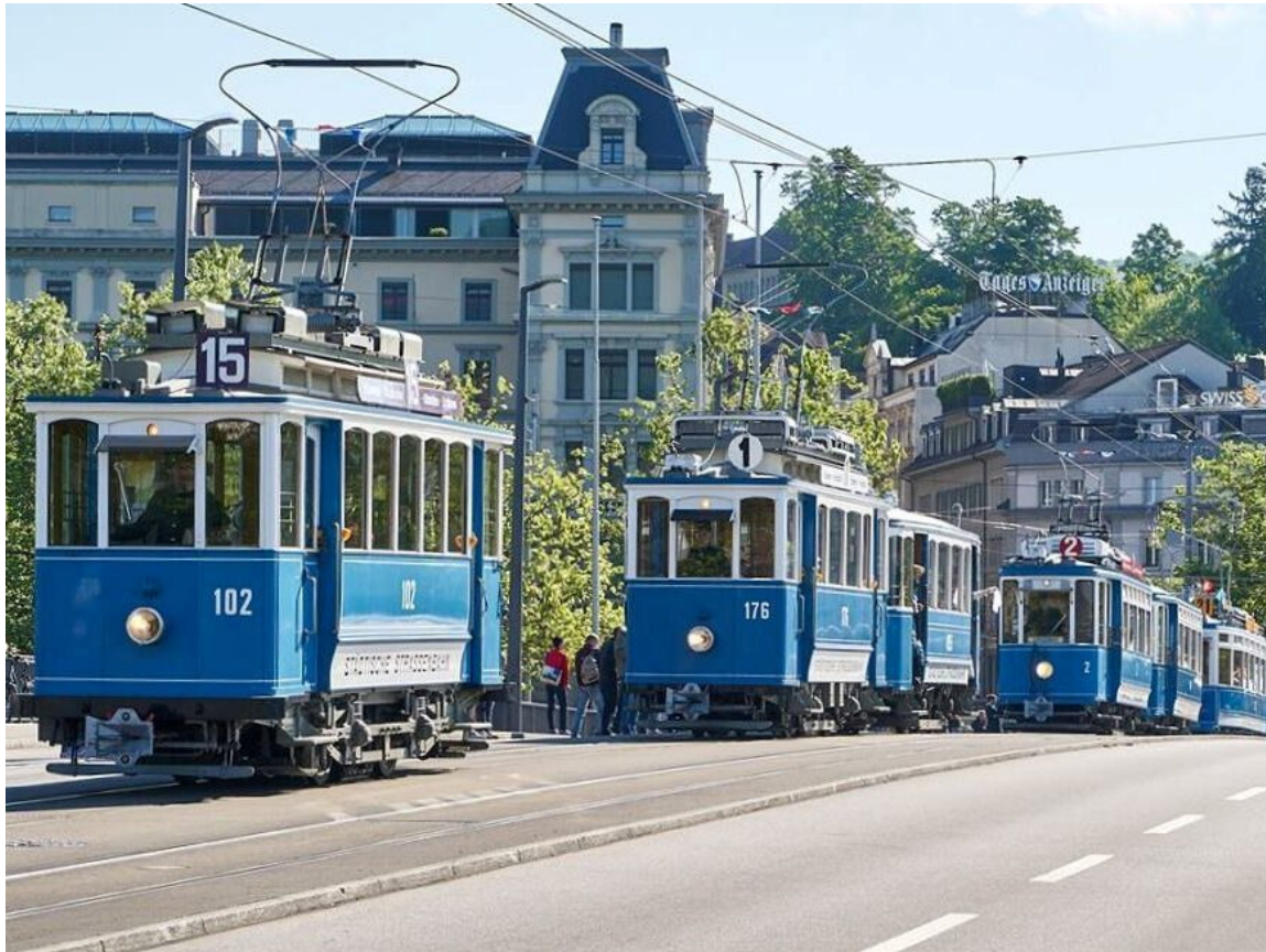
„Züri- Tram- Parade“

„So- Wanderig- ZH Wolfbach“ „Mitten in der Natur der Stadt Zürich“ 15.10.2023