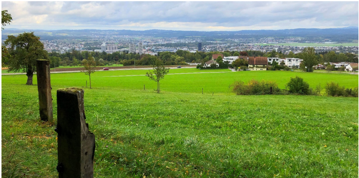
... in Richtung Kloten, unten ist Dübendorf