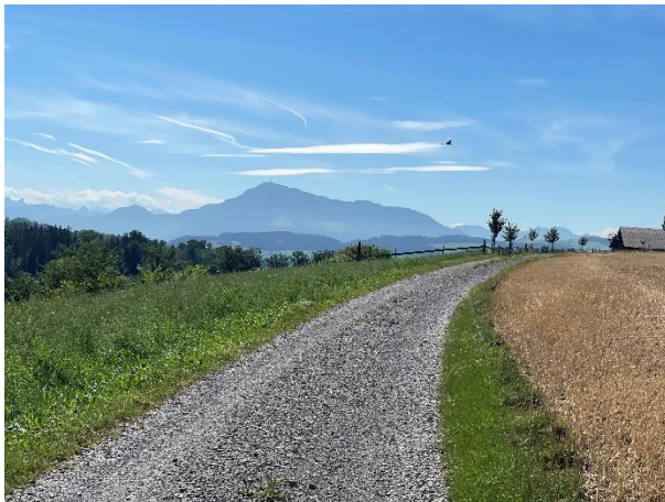
Anmarsch Tagsatzungstruppen bei Oberrüti