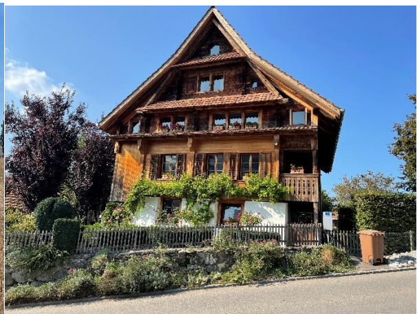
Unsere Einkehr – ein überlebender Zeitzeuge