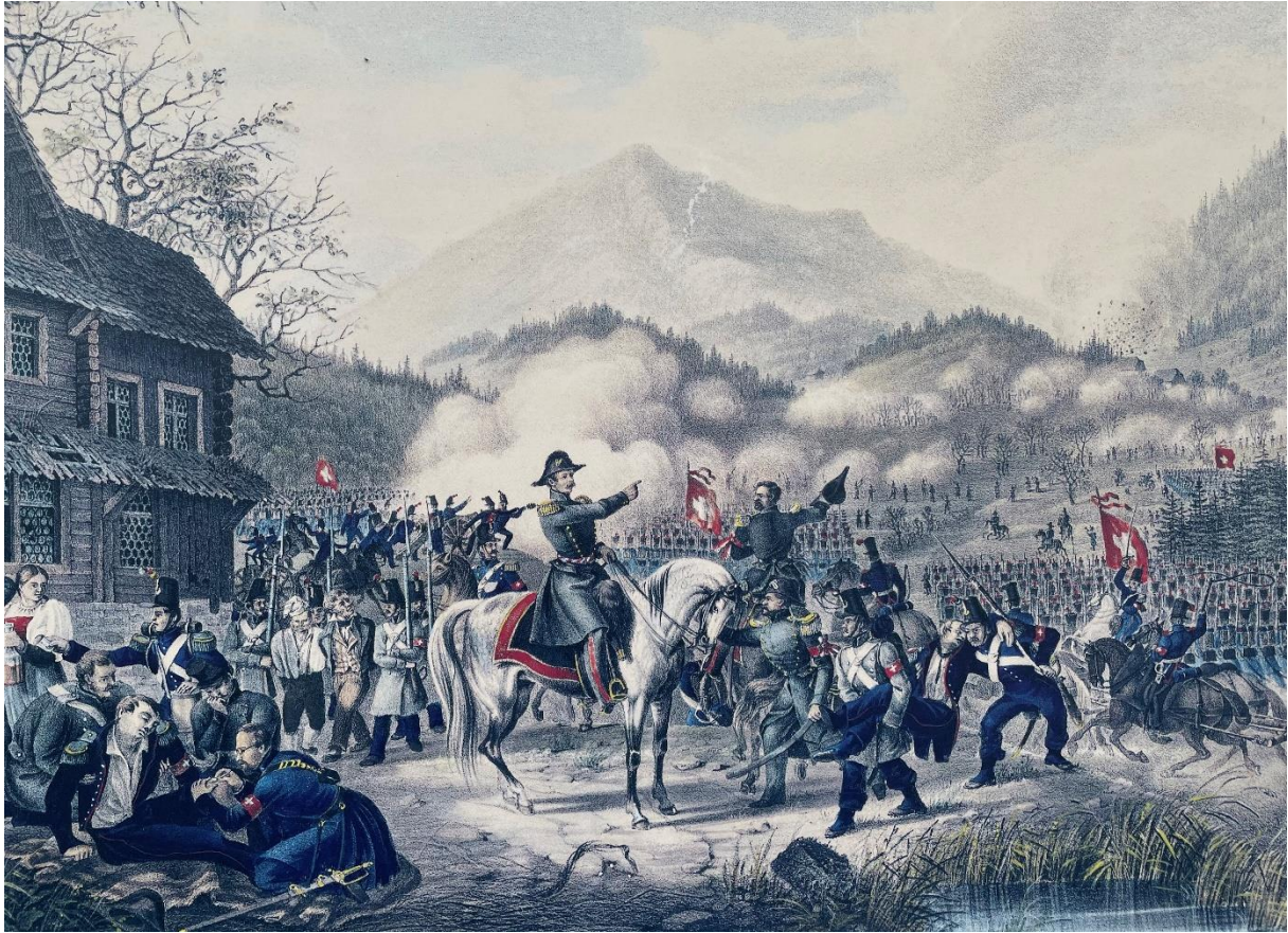
Gefecht bei der Brücke Gisikon