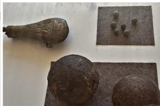
gefundenen Gewehr- u. Kanonenkugeln