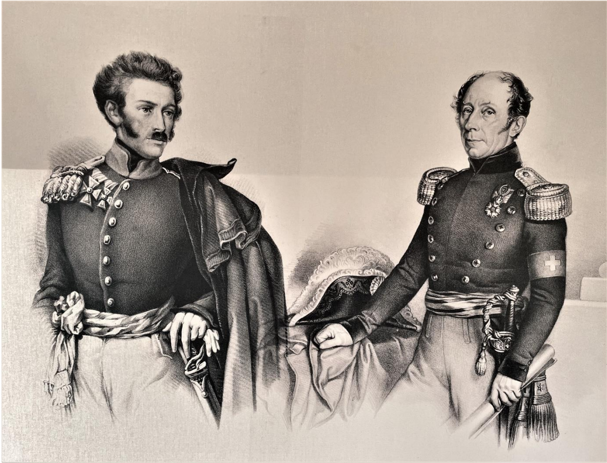
General Salis Soglio – Sonderbundstruppen LU/UR/SZ/OW/NW/FR/VS/ZG hat kapituliert Neutral: NE/AI