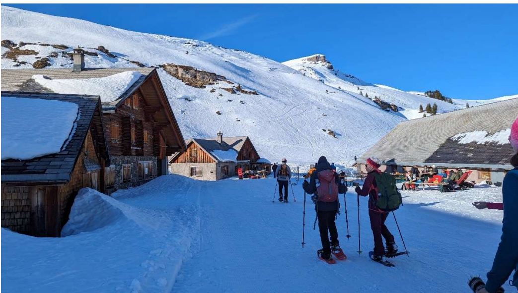
Zurück bei der Alp Fursch