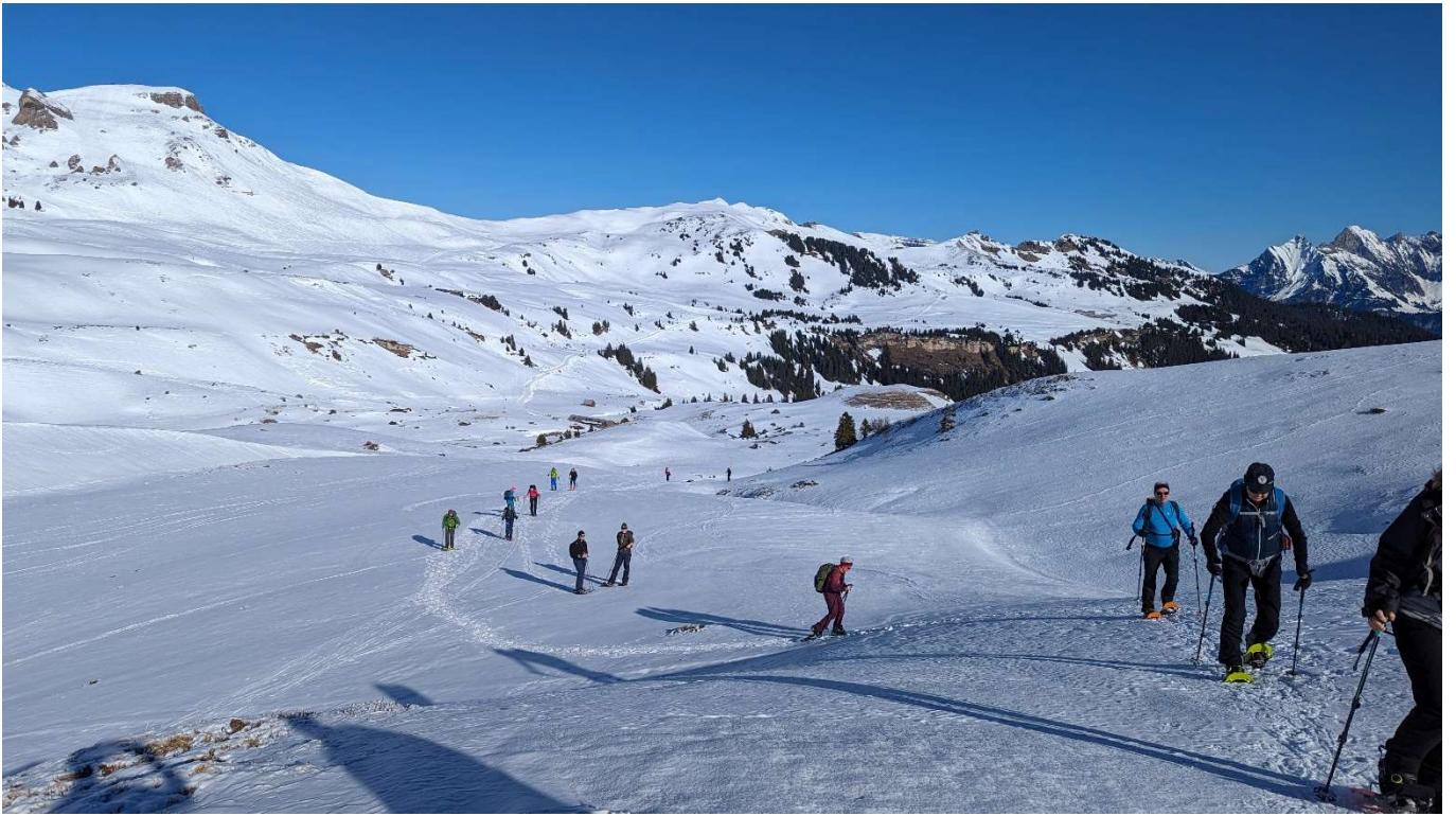
Abseits der Schneesohle - „Autobahn“ über den Rietboden