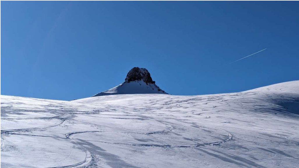
Der Spitzmeilen 2501 m