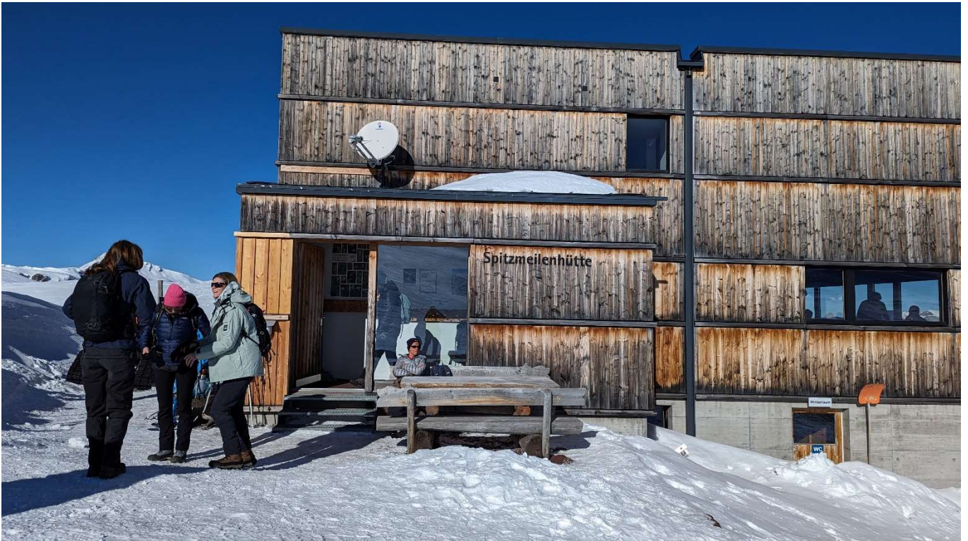
Die Spitzmeilenhütte des SAC Piz Sol