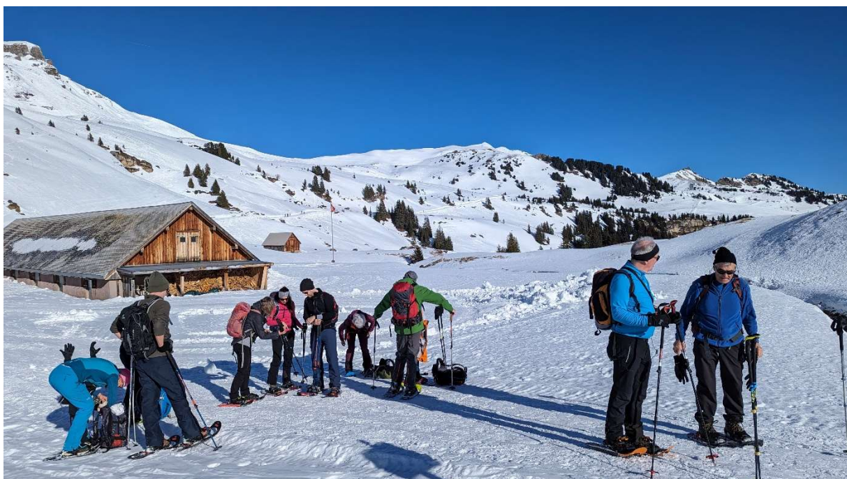
Nach kurzem Anstieg hinunter zur Alp Fursch