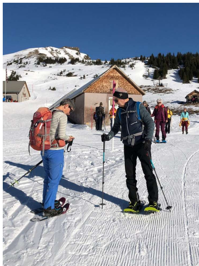
nach der LVS Kontrolle ging's los