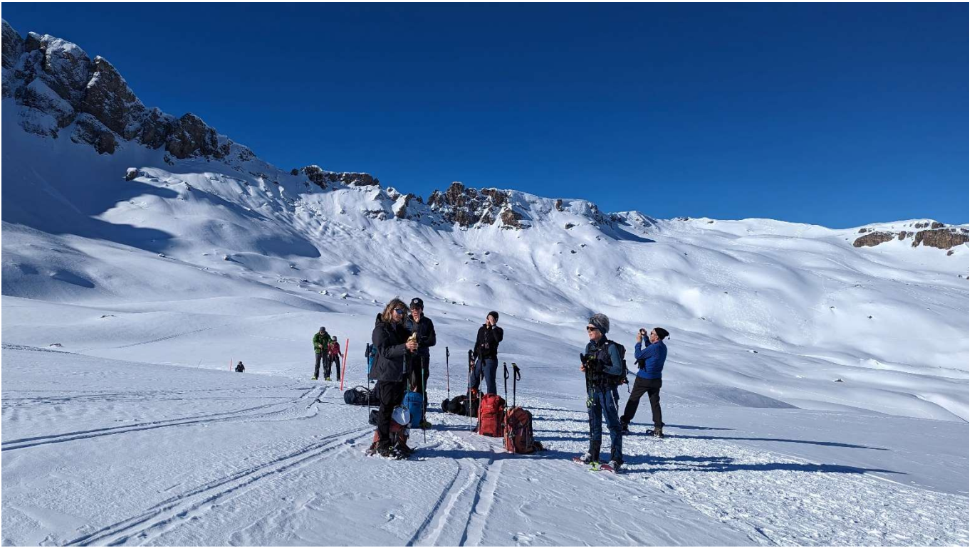
Bald geschafft ....