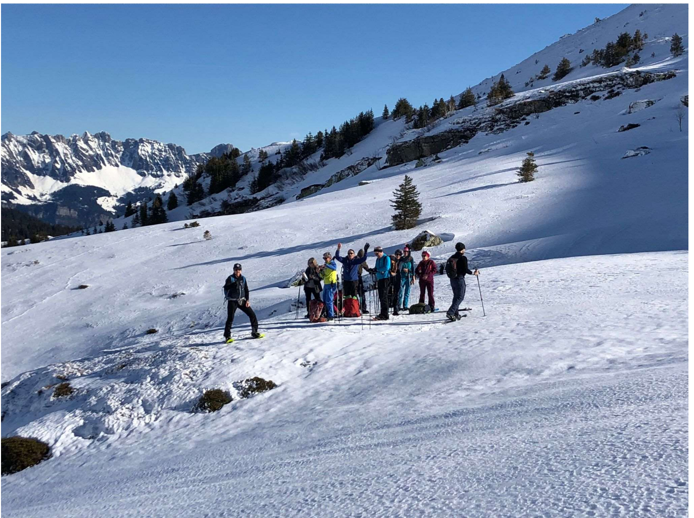
Pause auf halber Strecke zur Spitzmeilenhütte