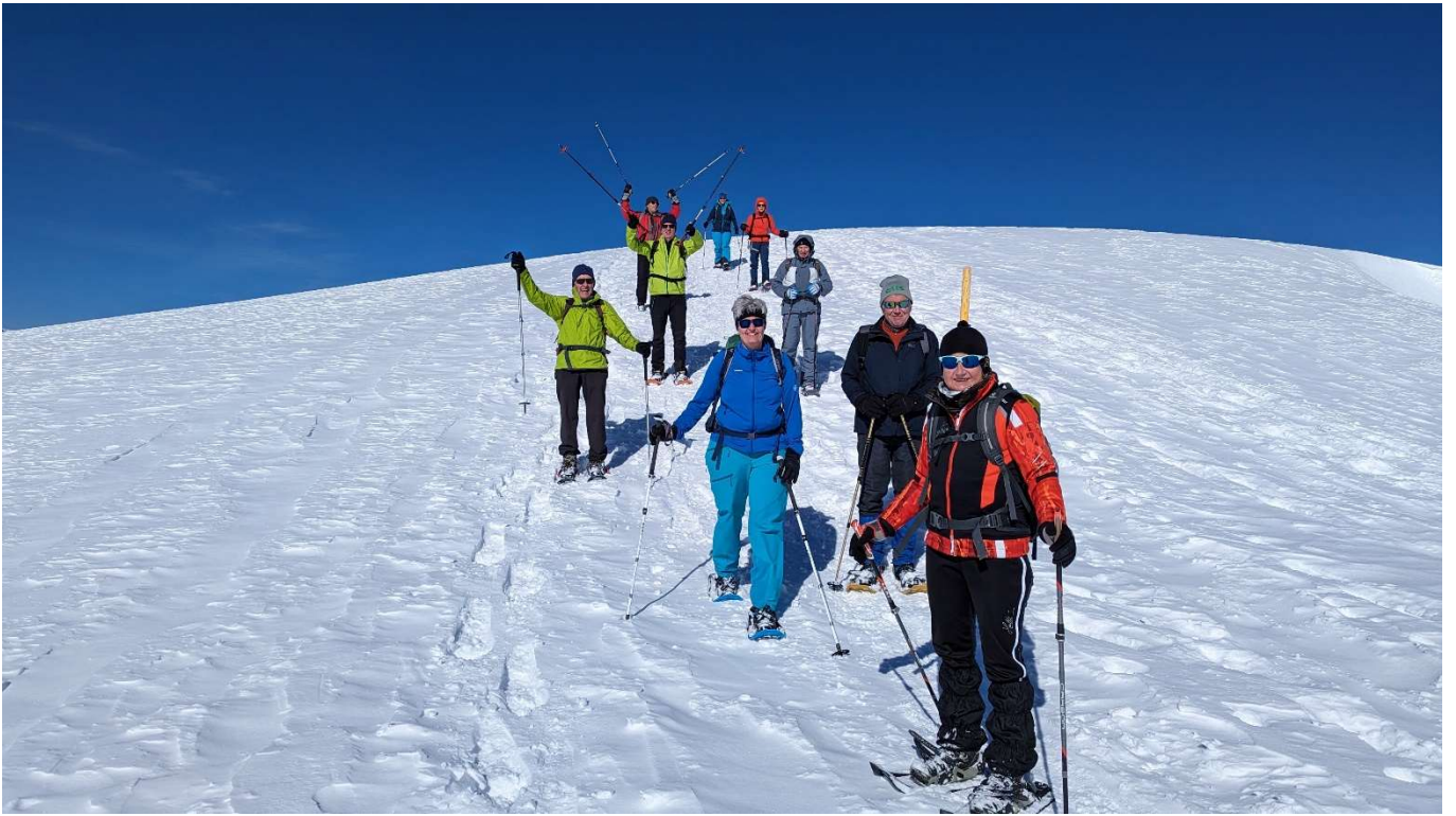
alle geniessen den wunderbaren Wintertag