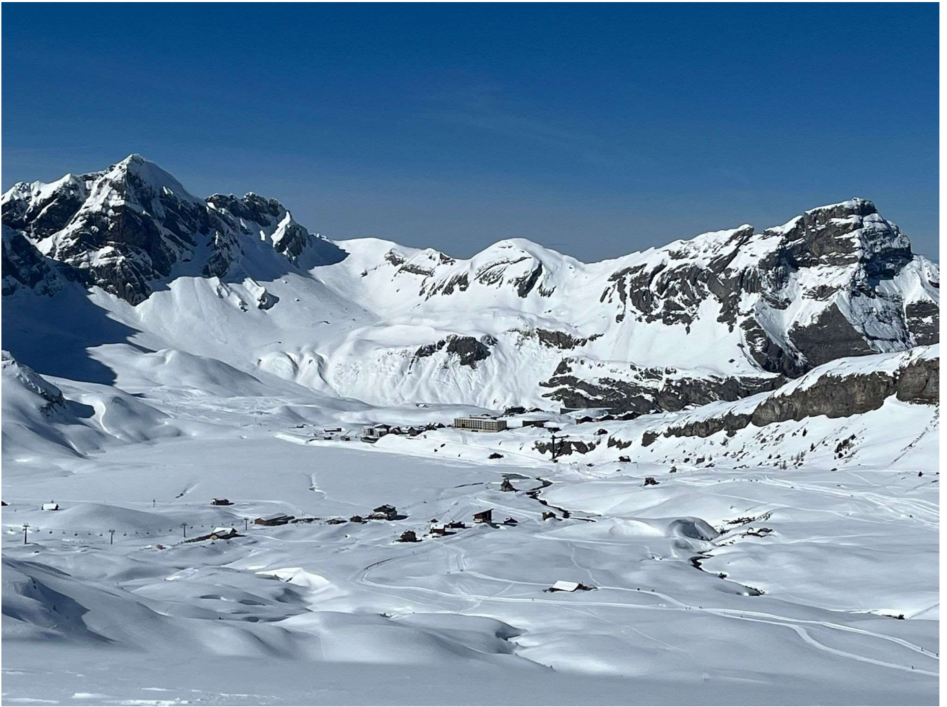
Blick auf den Distelboden, Melchsee und das Fruitt Dörfli