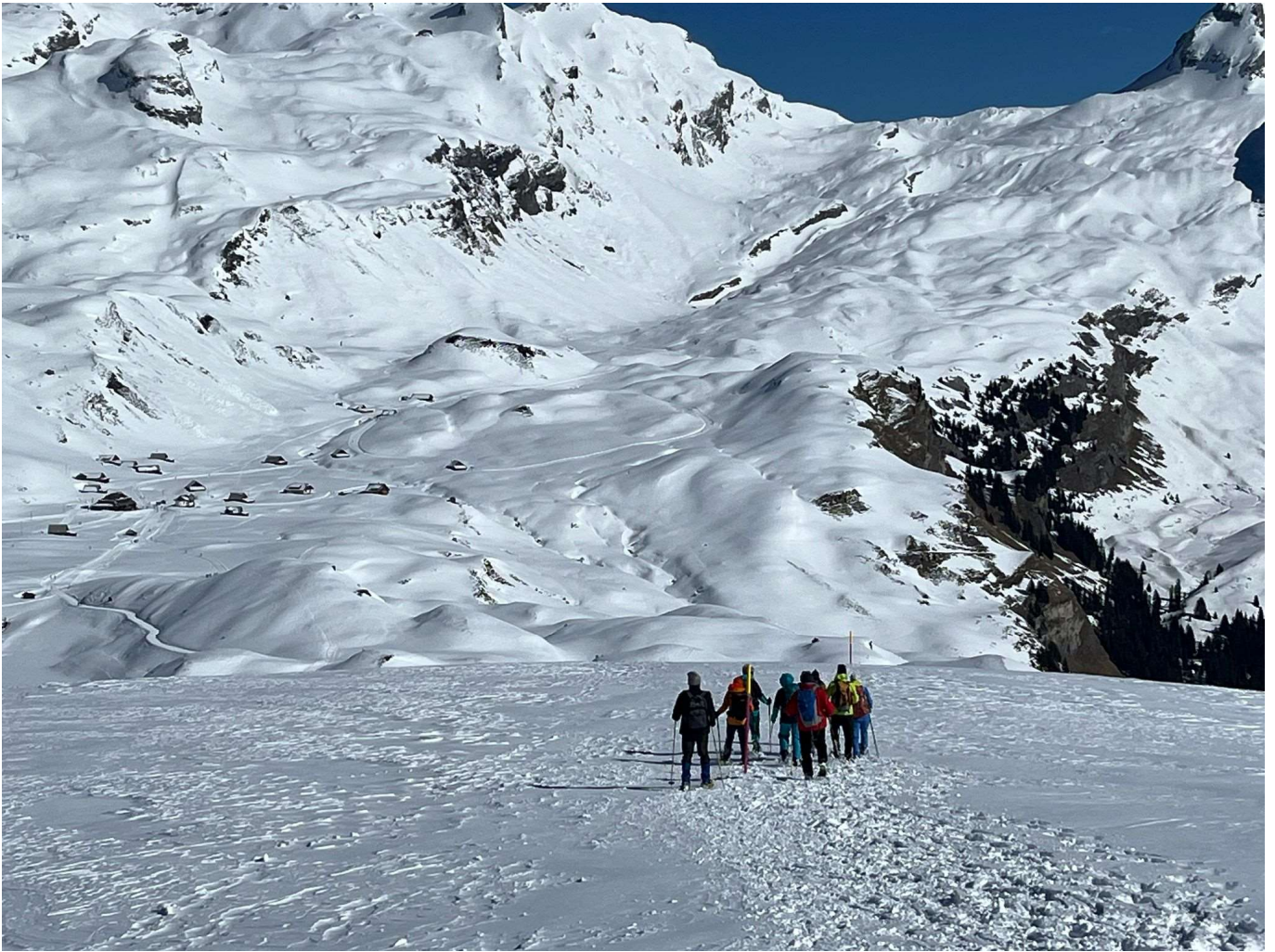
Abstieg zur Tannalp