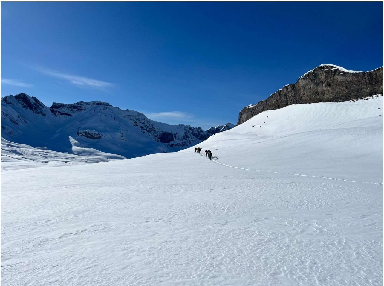
Allein auf weiter Flur