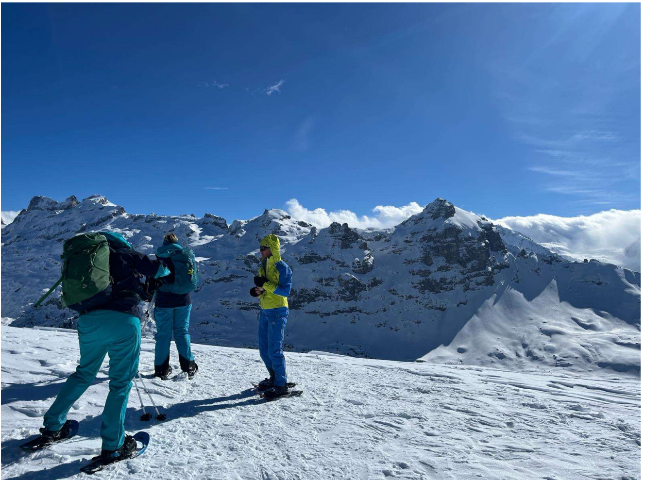
Hier auf der Ärzegg heisst es: Jacke anziehen