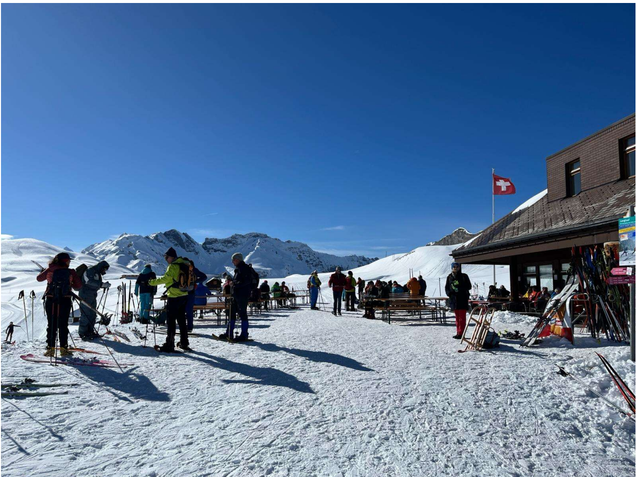
Mittagspause in der Tannalp