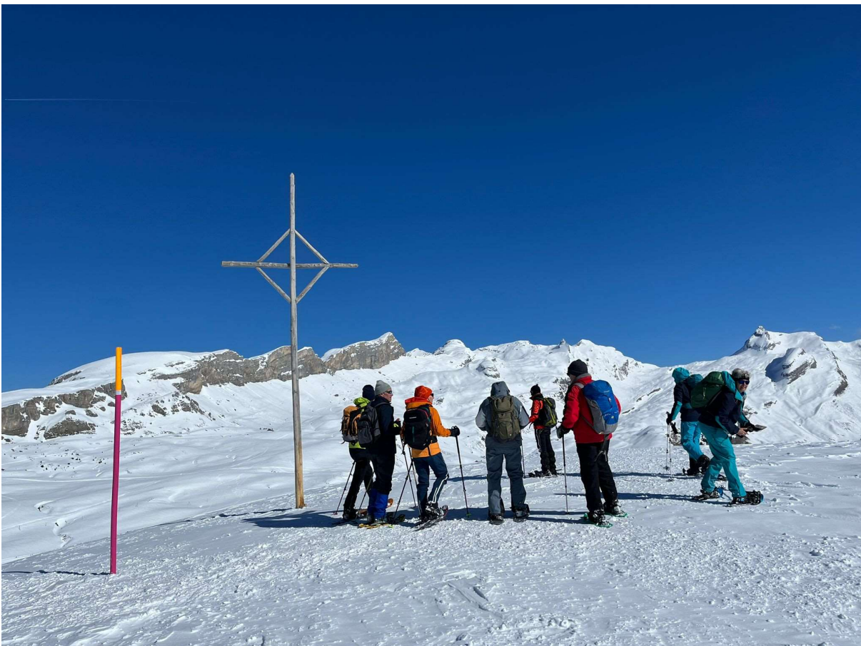
Kreuz der Ärzegg 2141 m. ü. M.