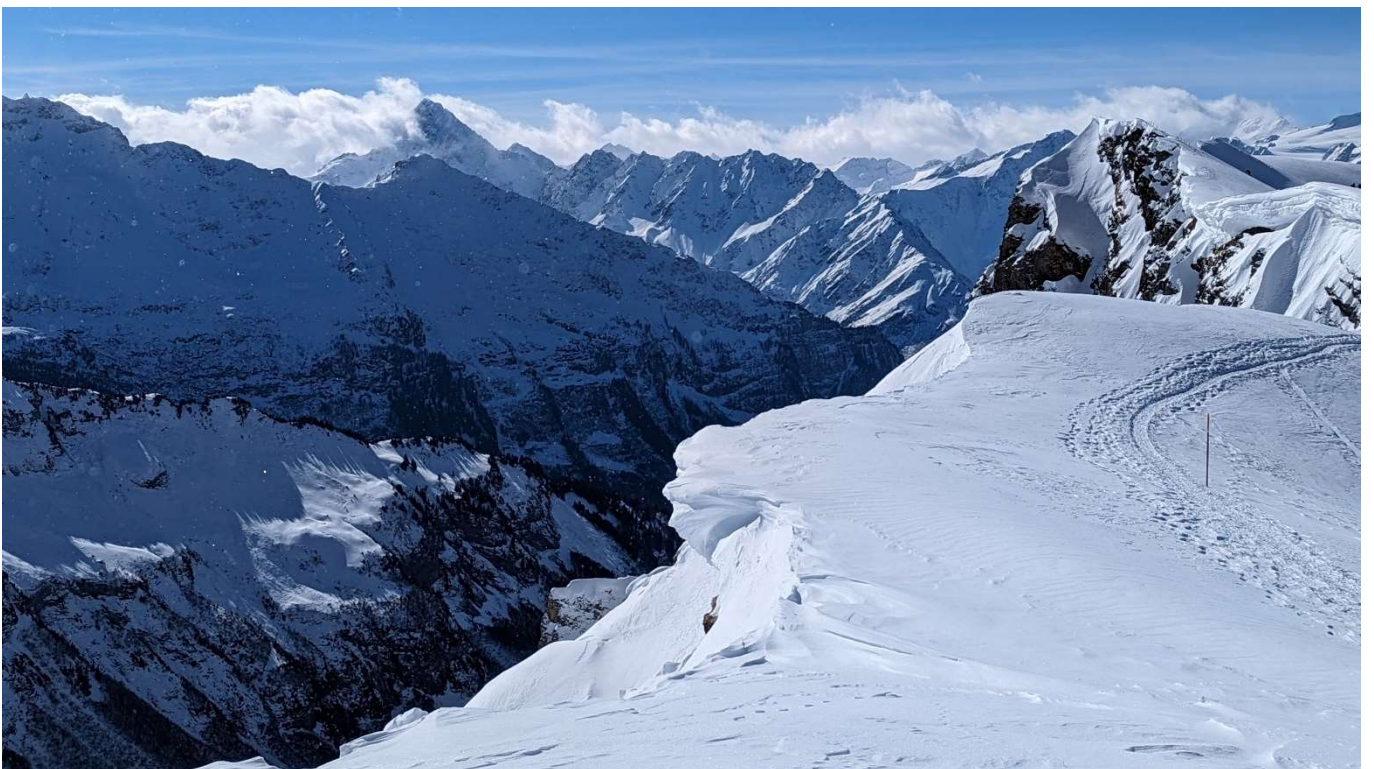
schöne Wächte auf dem Rücken der Ärzegg