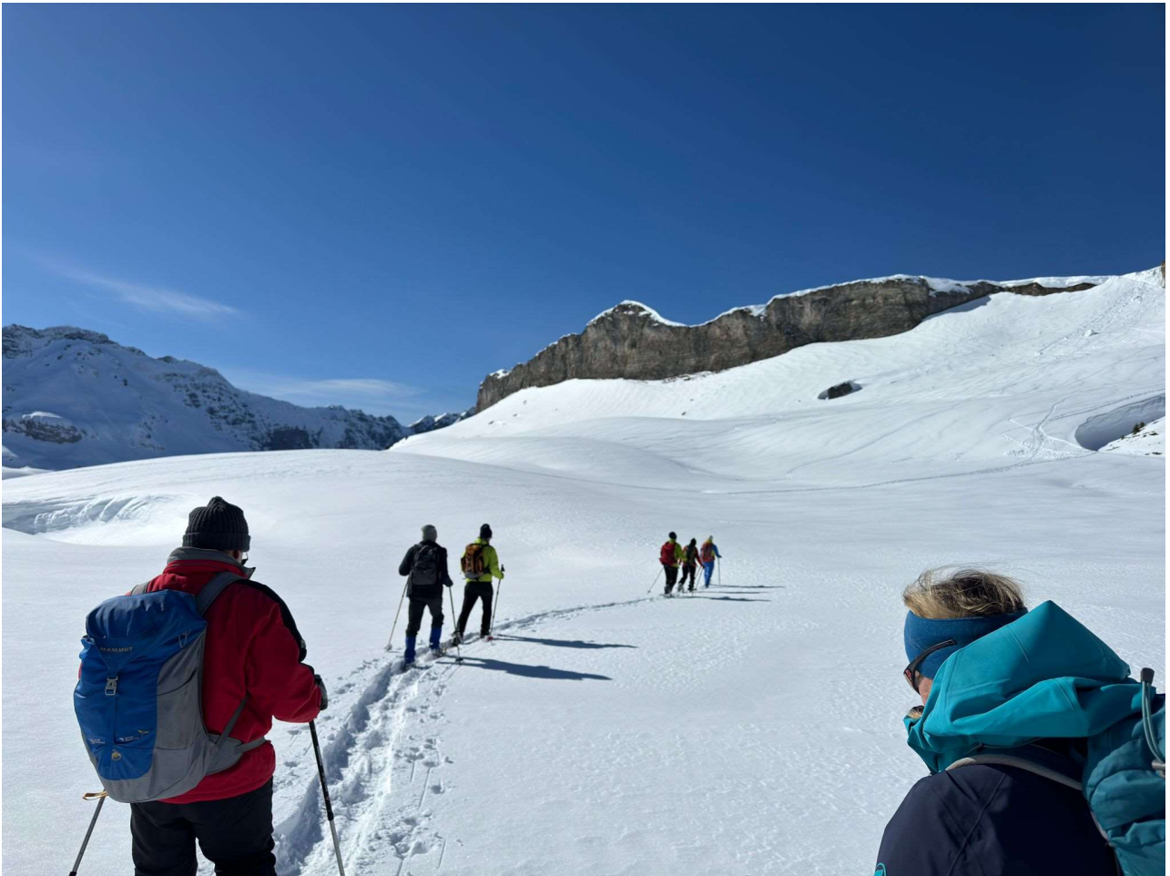
Weg zurück zur Frutt, oberhalb des offiziellen Weges