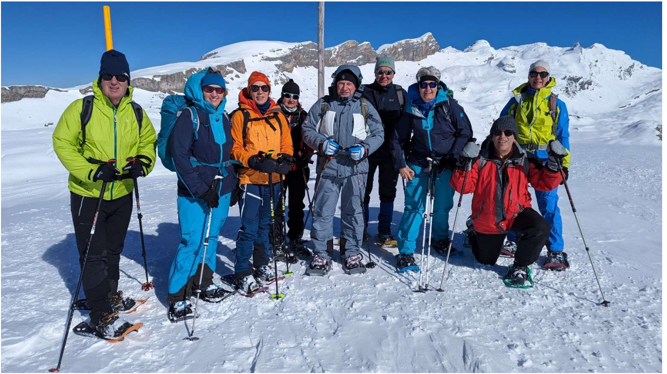
Ein Gipfelfoto darf nicht fehlen