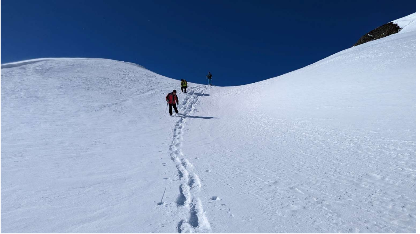
... und durch unverspurtes Gelände