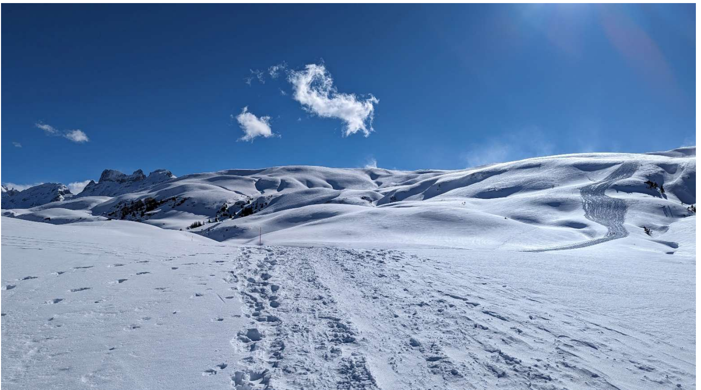
die Ärzegg unter den zwei Wölkchen in Sicht