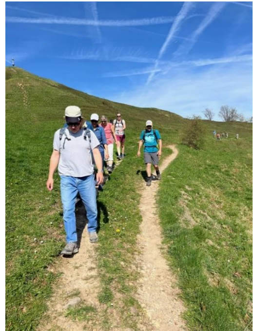
Unterwegs bei herrlichem Frühlingswetter