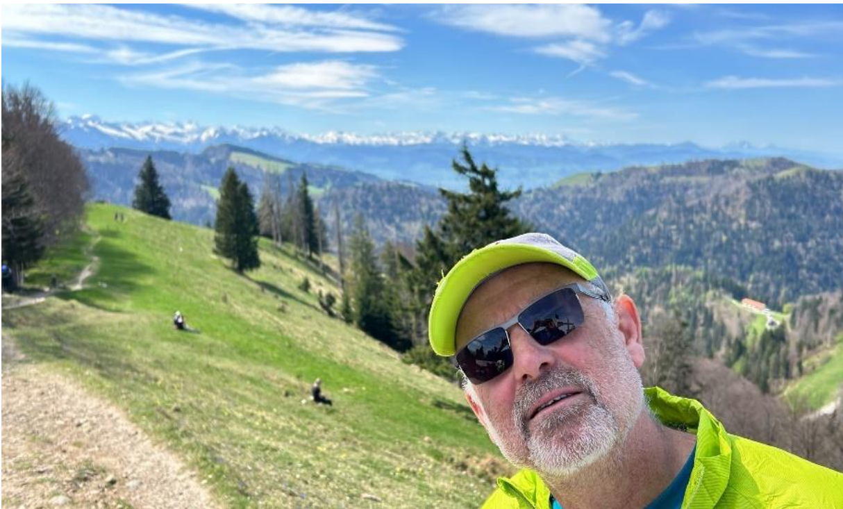
Wer guckt denn da 😊