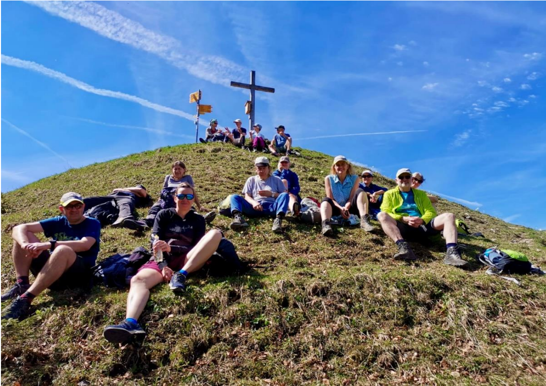
Picknick auf dem Gipfel