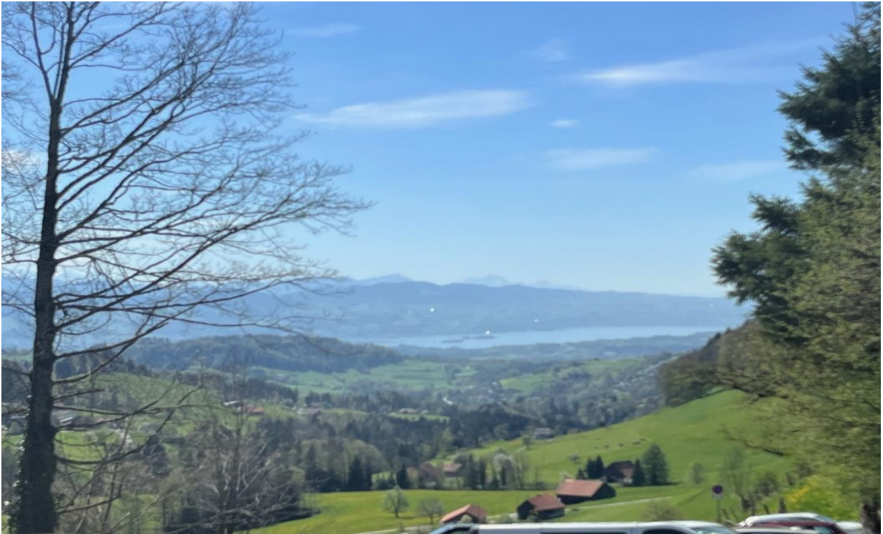
Blick auf den Zürichsee