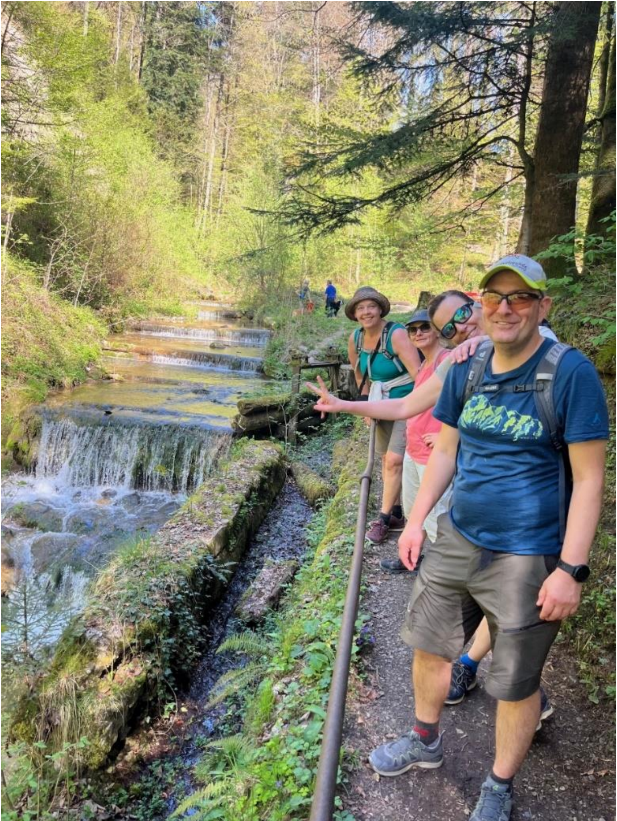
Unser Präsi – Bild mit Damen 😊