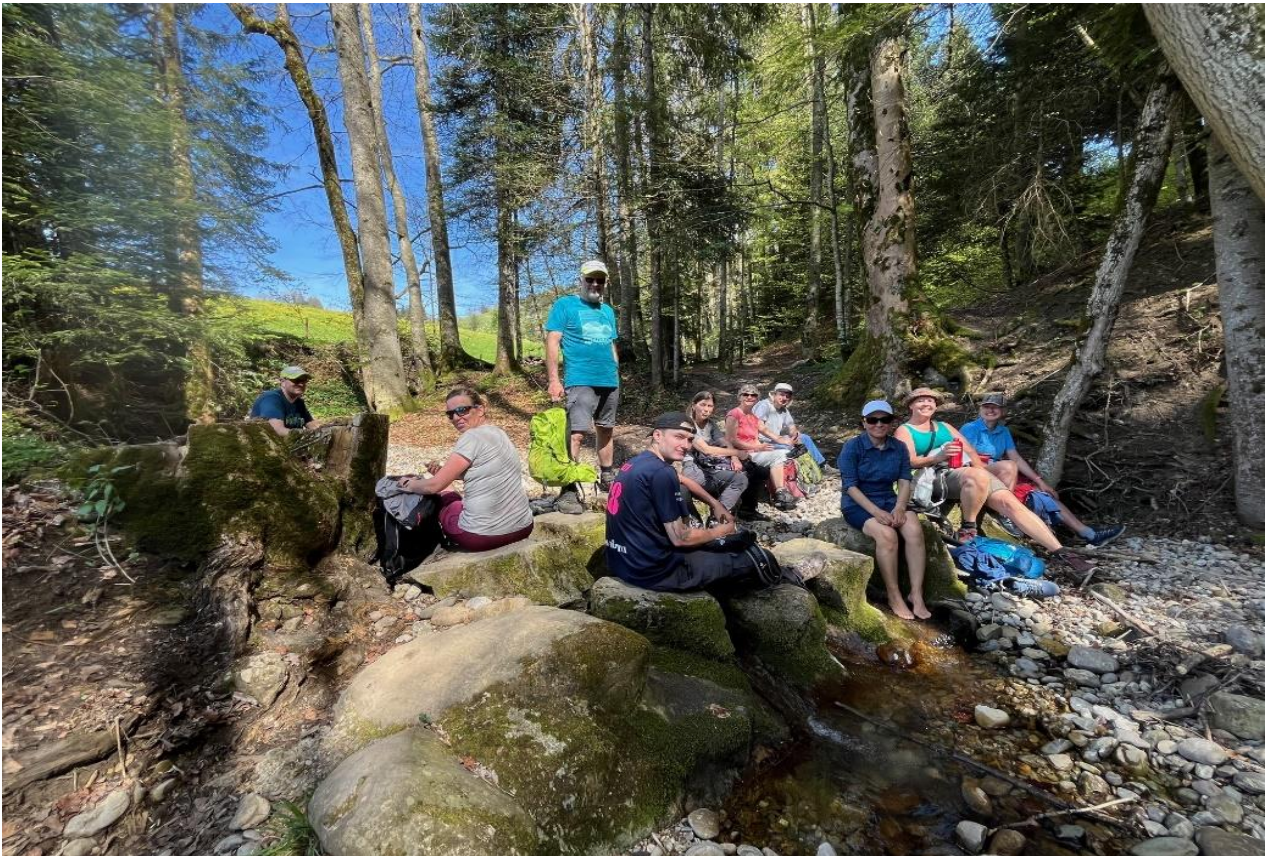
Kurze Rast am Schmitenbach