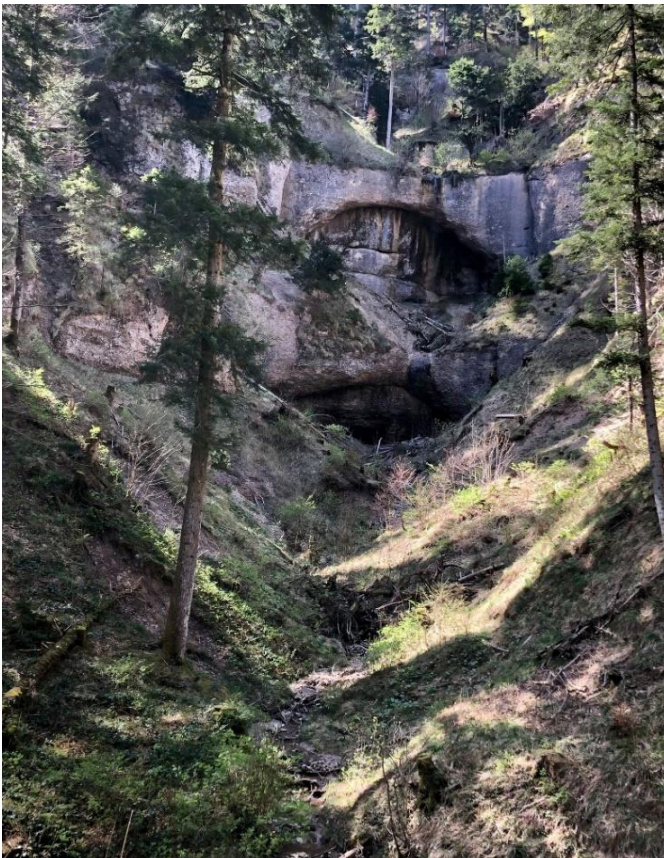
Der Nebentöss entlang