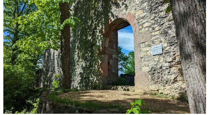
Unterwegs zur dritten Ruie. Die Ringmauerburg ist zusätzlich durch einen künstlichen Halsgraben gesichert