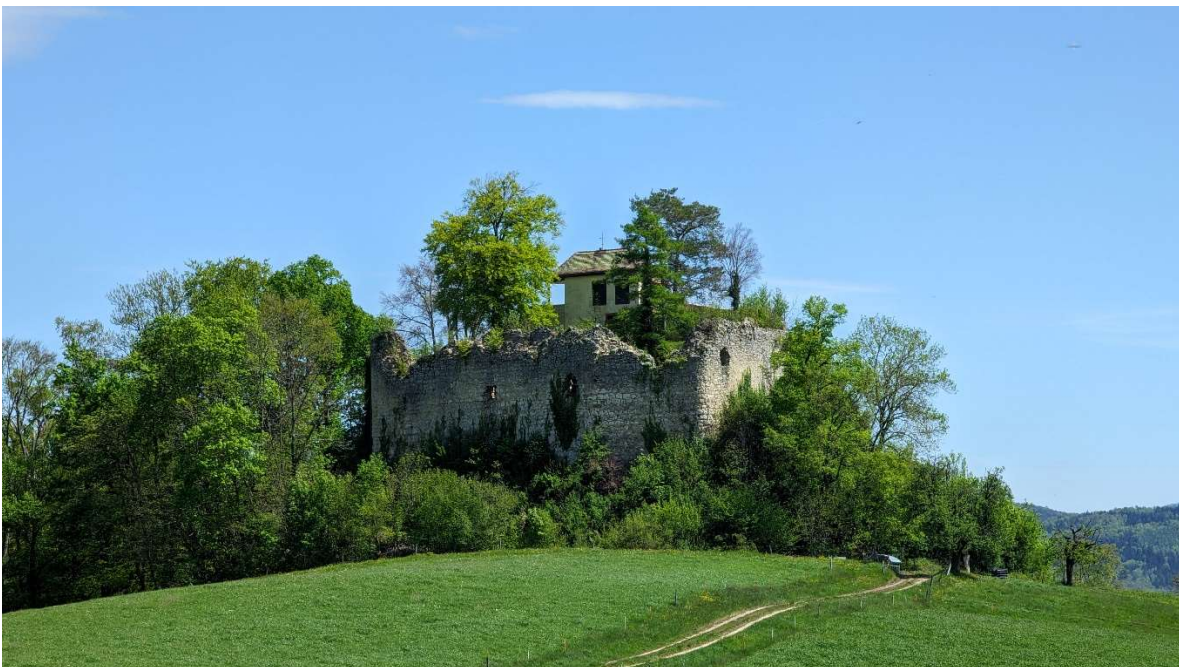
Burgruine Neu Schauenburg