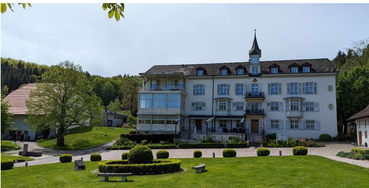
Hotel Restaurant Bad Schauenburg - leider wegen geschlossener Gesellschaft auch geschlossen