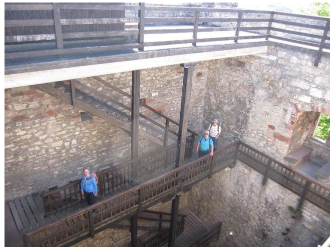
Der Wohnturm der mittleren Ruine konnte bestiegen werden