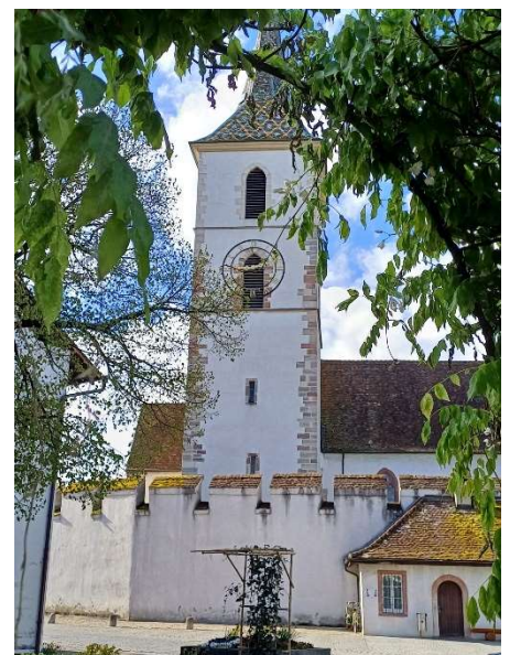
Wehrkirche St. Arbogast der evangelisch-reformierten Kirchgemeinde des Kantons Basel-Landschaft