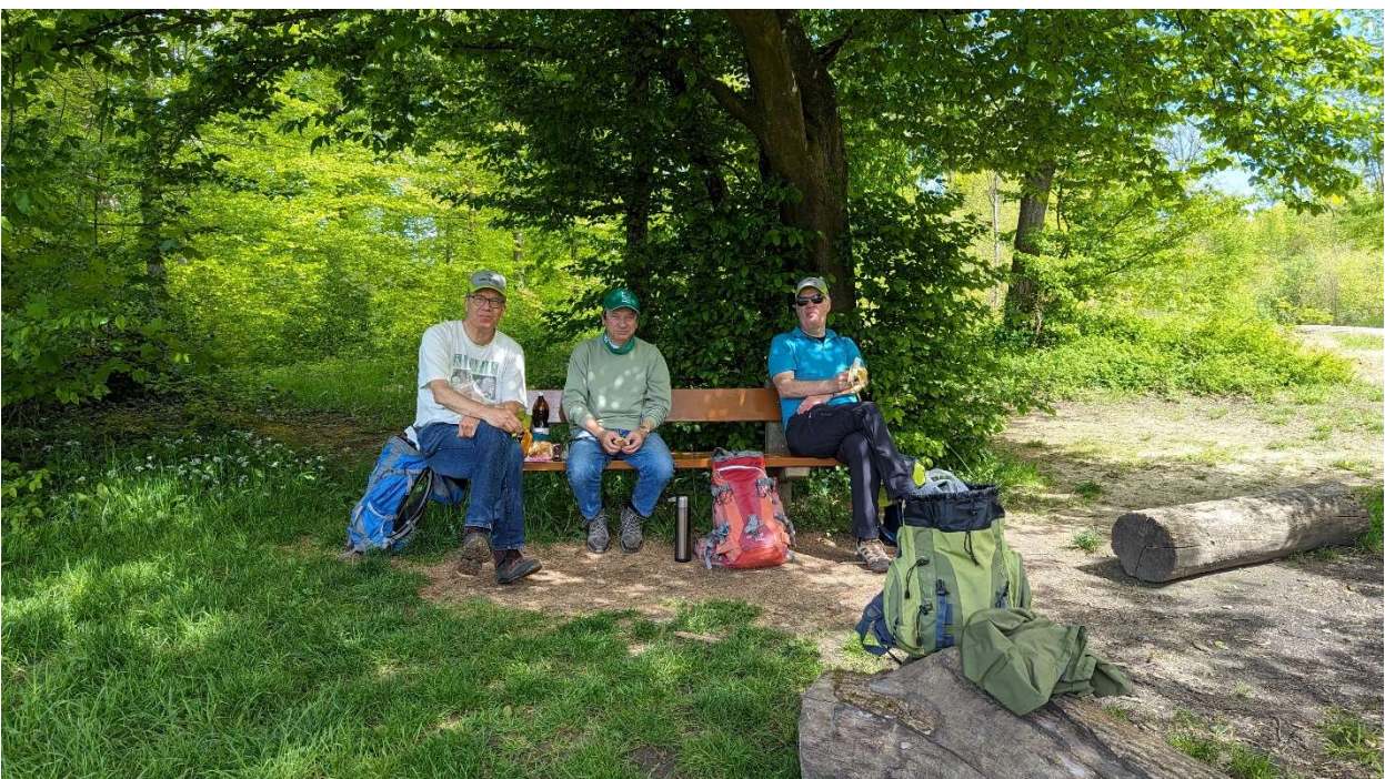
Mittagspause kurz vor Eggligraben, das Restaurant war leider geschlossen