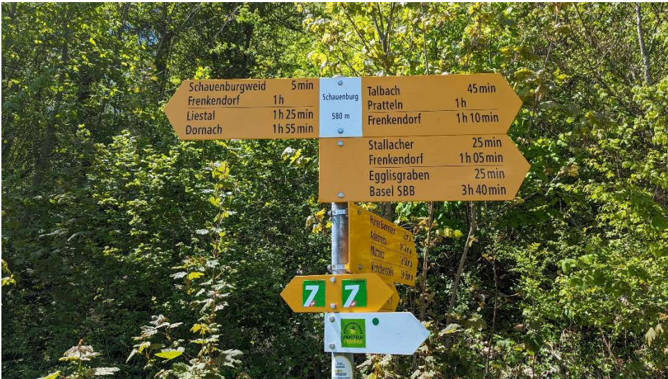
Höchster Punkt unserer Wanderung 580m