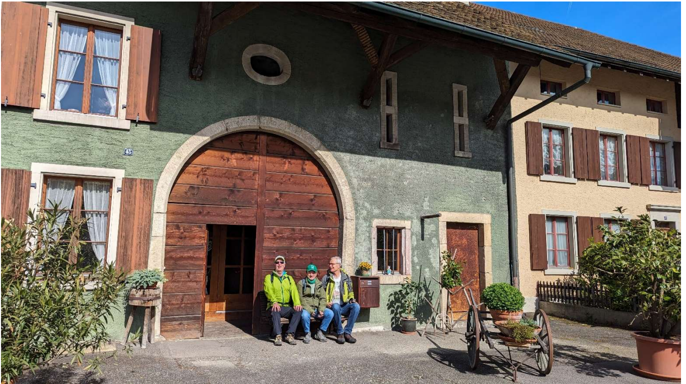
Mittertennhaus (Dreisässenhaus) im alten Dorfkern von Muttenz

Zu viert wanderten wir in Muttenz nach der Kaffeepause los. An schmucken alten Bauernhäusern vorbei erreichten wir die Wehrkirche St. Arbogast. Das ist das einzige Gotteshaus der Schweiz, welches von einer fast kreisförmigen Ringmauer ganz umschlossen ist.